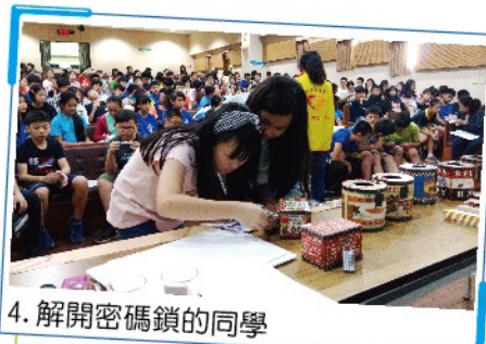
4. 解開密碼鎖的同學