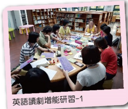
英語讀劇增能研習-1

狂大笑！接著幾場的入班活動，看著小朋友們聚精會神的欣賞表演，時而與演員互動，時而自己唸唸有詞，相信此刻不管台上台下皆充滿了成就感！最重要的是，大人是孩子們最好的榜樣，一群熱血的爸爸媽媽，用英文站上台演出《小紅帽》，讓孩子們感受到的愛與溫馨，或許是在推廣英語閱讀之外，更充實更美好的收穫了吧！