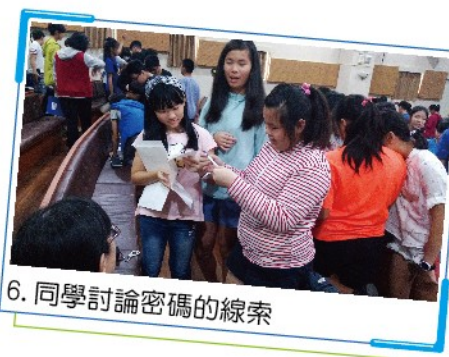
6. 同學討論密碼的線索