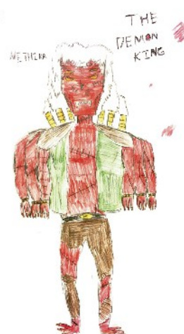
The Demon King