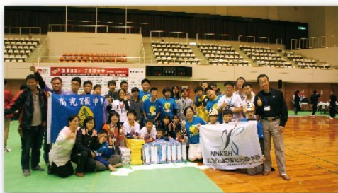
加賀市長(右)一同與本校學生及同團他校師生共同合影留念(前面滿滿都是獲獎獎品)