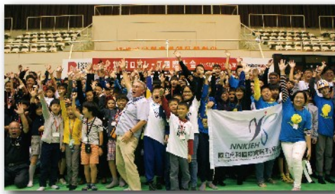
所有臺南隊伍賽後與創辦人一起大合影留念!