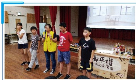
1. 同學體驗臉部印記的感受