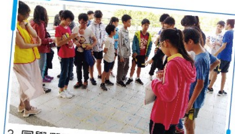
3. 同學們研究地上的數字密碼