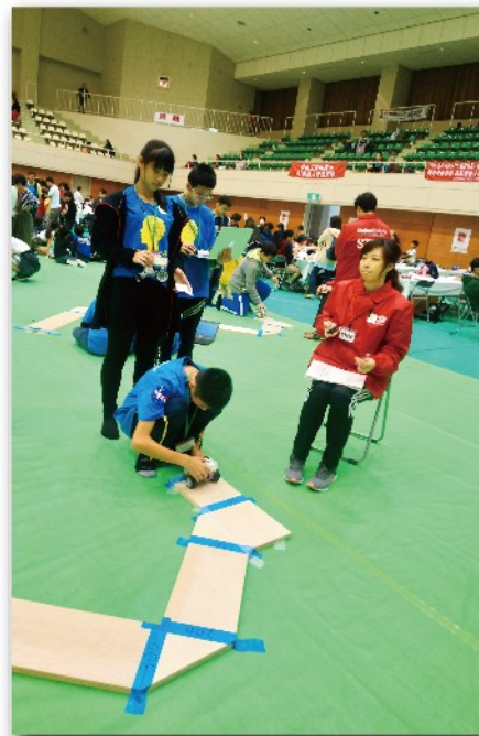
今年出現的極窄迷宮賽道，程式需要不斷測試修正才能通過