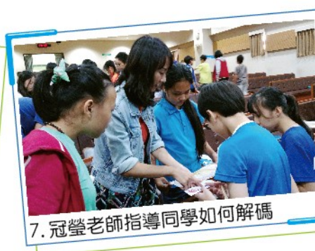
7. 冠瑩老師指導同學如何解碼