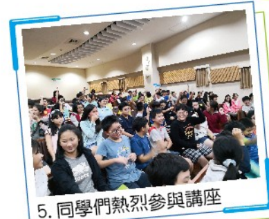
5. 同學們熱烈參與講座