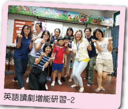
英語讀劇增能研習-2