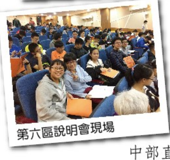
第六區說明會現場

南科實中是台南數一數二班級數少，學生人數少的一間科學高中。但是面對全國其他明星高中的表現卻不遑多讓！在全國以素養為導向如火如荼討論108新課綱時，多元發展早就在南科實中實施多年。假日如果走進這個校園，你會發現各個角落都有許多追夢者。有的準備問鼎明年的FRC國際賽，有的準備參加高瞻發表，有的準備角逐日本筑波上台演說的機會，有的挑戰學科各種競賽...南科實中的假日是南科之子造夢追夢的舞台。