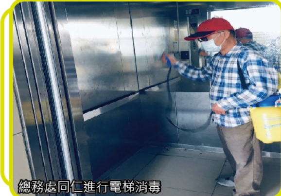
總務處同仁進行電梯消毒