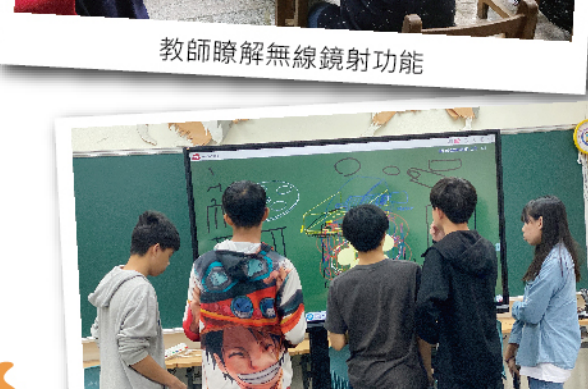
學生善用科技輔助自主學習