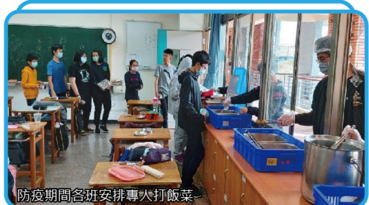
防疫期間各班安排專人打飯菜