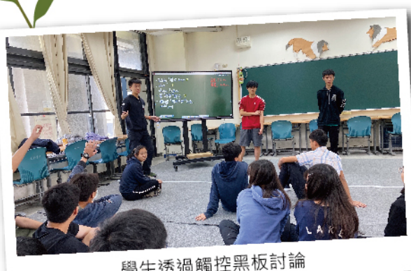
學生透過觸控黑板討論

未來學校也將持續編列經費，爭取計畫，持續改善校園，透過科技輔具激發學生潛能，吸引孩子的學習動機與興趣，讓各項設施發揮最大效益。