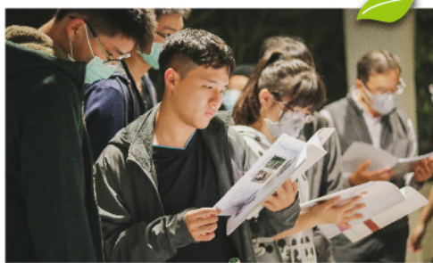
參加者可以觀摩歷屆學長姐的書審資料