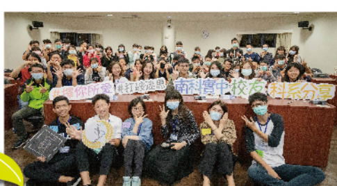
講師與籌備校友及學弟妹合影

參考資料：大學選系好南科科臉書粉絲專頁 https://www.facebook.com/NNKIEHsCollegeFair/