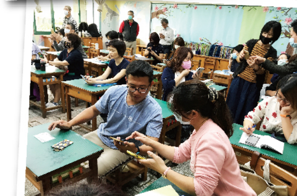
教師精進研習熟悉科技輔具