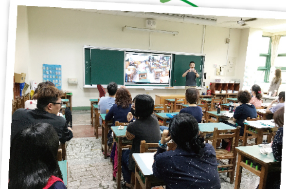
教師瞭解無線鏡射功能