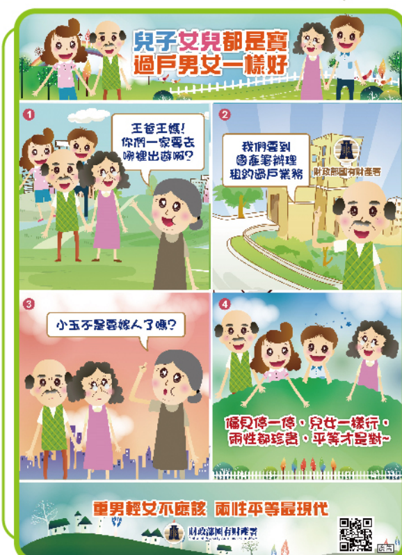
宣傳文宣-兒子女兒都是寶 過戶男女一樣好