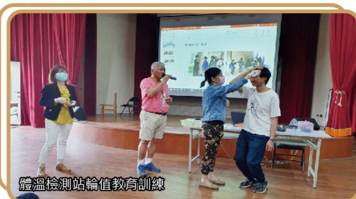
體溫檢測站值教育訓練