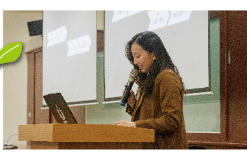
中山醫牙醫系游子觀學姐笑稱牙醫醫治的是32個小生命