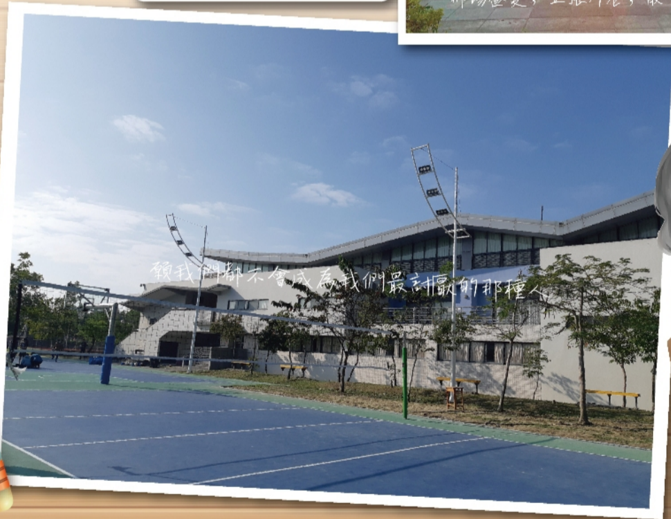
願我們都不會成為我們最討厭的那種人