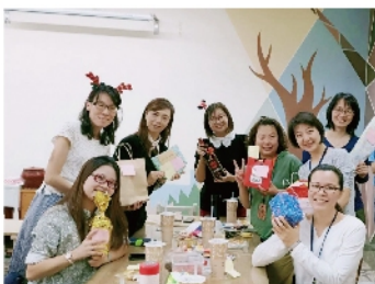
故事志工同樂會 感謝無私奉獻