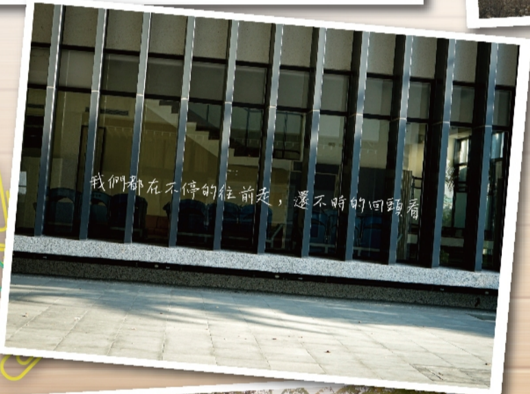
我們都在不停的往前走，還不時的回頭看