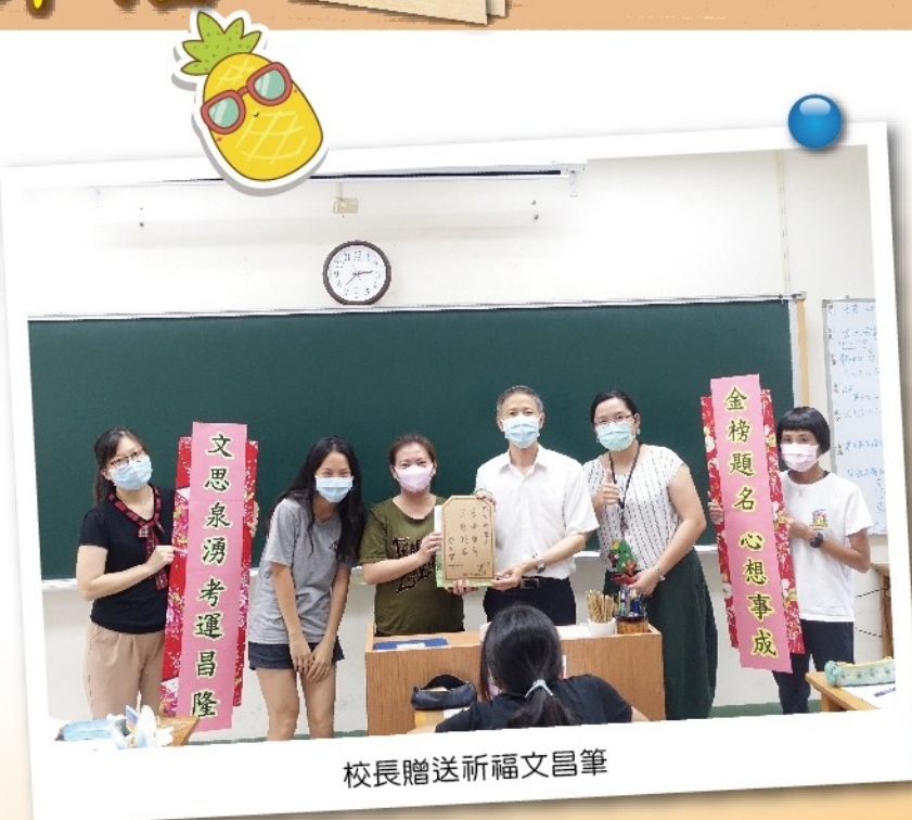
校長贈送祈福文昌筆

校長也親自至九年級各班教室勉勵考生，並致贈象徵「文思泉湧」文昌筆及「金榜題名」金莎巧克力，這些都是校長、主任以及九年級導師們至善化慶安宮祈求神明加持的，祝福南科學子考運昌隆，心想事成。透過「金榜題名，繪馬祈福」活動，九年級的同學們寫下自己的心願，高掛祈福繪馬，所有考生可以稍稍放鬆緊繃的情緒。看著一個個的繪馬，代表每一個孩子的夢想，也讓孩子知道學校師長們及家長的用心良苦，在應考過程中也更能珍惜老師與爸爸媽媽們的付出。