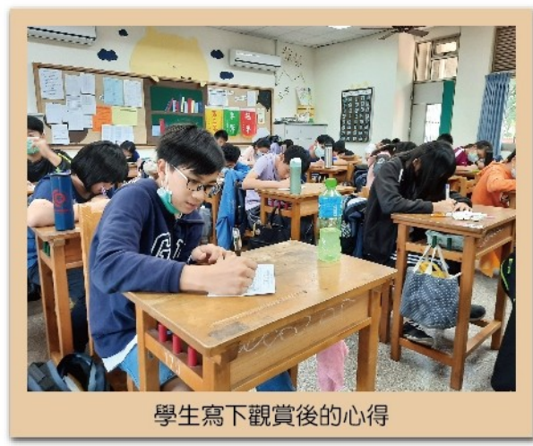
學生寫下觀賞後的心得

中醫，而有同學的夢想是學古箏。而大部分同學都說不太了解自己的父母，也覺得父母不完全了解自己，也有很多同學表示自己不了解自己。好幾位同學都說，他們和家人間其實都不太了解對