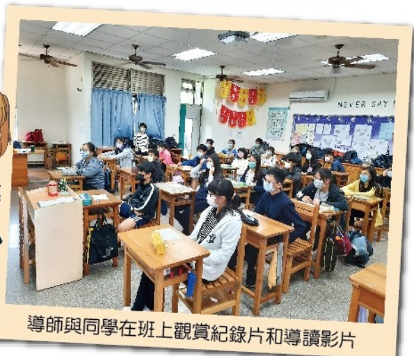
導師與同學在班上觀賞紀錄片和導讀影片