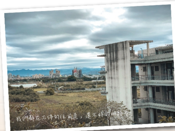
我們都在不停的往前走，還不時的回頭看