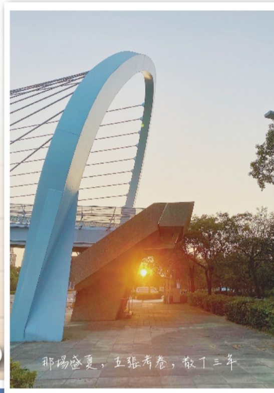
那場盛夏，五張考卷，散了三年