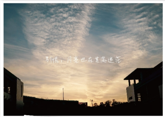
別慌，月亮也在某處迷航