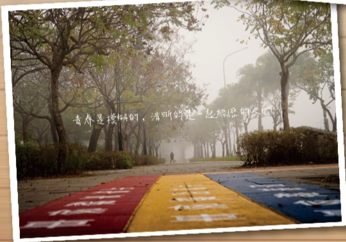
青春是模糊的，清晰的是一起經歷的歲月