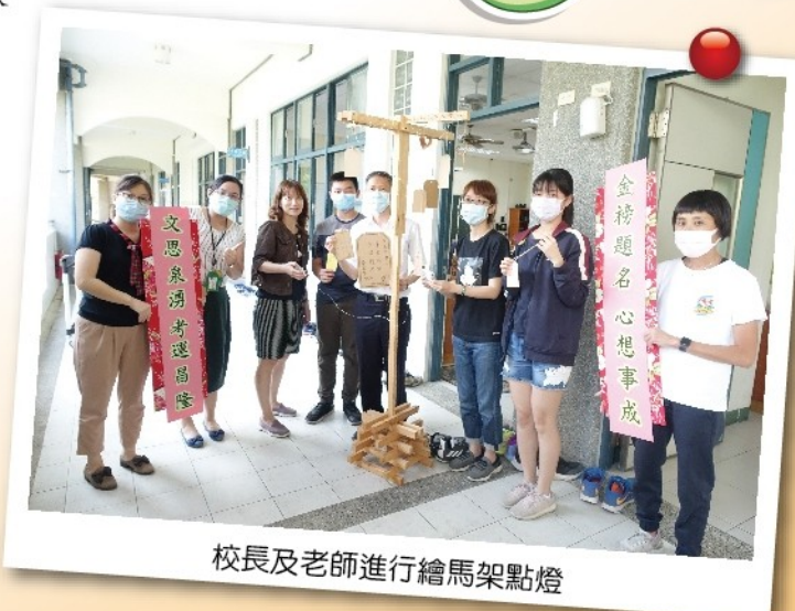
校長及老師進行繪馬架點燈