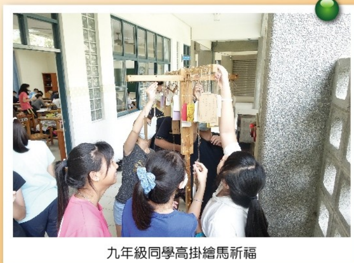
九年級同學高掛繪馬祈福