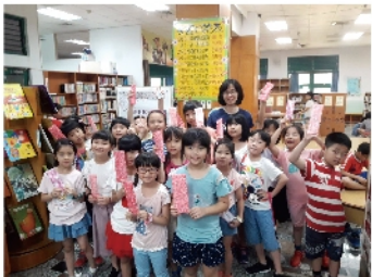
圖書館有獎徵答活動