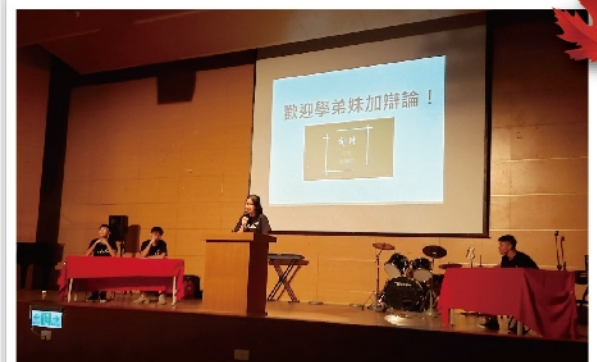
演辯社社團招生演出