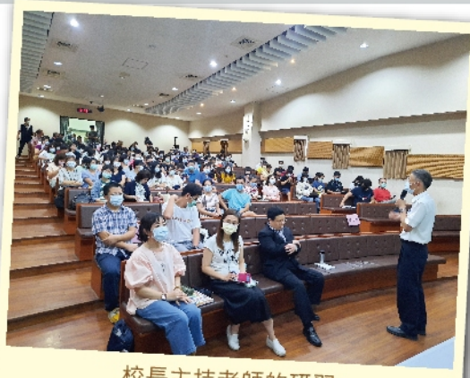
校長主持老師的研習

迎接新課綱時代，老師們和同學一樣，必須不斷的學習前進。期待老師們的準備，能帶給同學們在新的學習旅程，有滿滿的收穫。