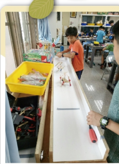
做好的機械獸要經過測試及修正，才能跑得更快更穩