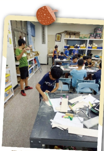
學生認真的磨手擲機機翼