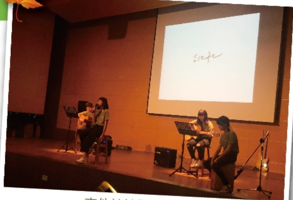
吉他社社團招生演出

活動結束了，辛苦的日子也跟著暫告一個段落。那些燒腦討論的時光已遠離，而美卻留在這綠意盎然的校園中，成為屬於佰土級之間的精彩歷史。