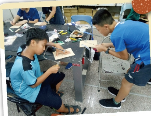
利用手線鋸切割木頭，也要注意不要切到桌子喔！