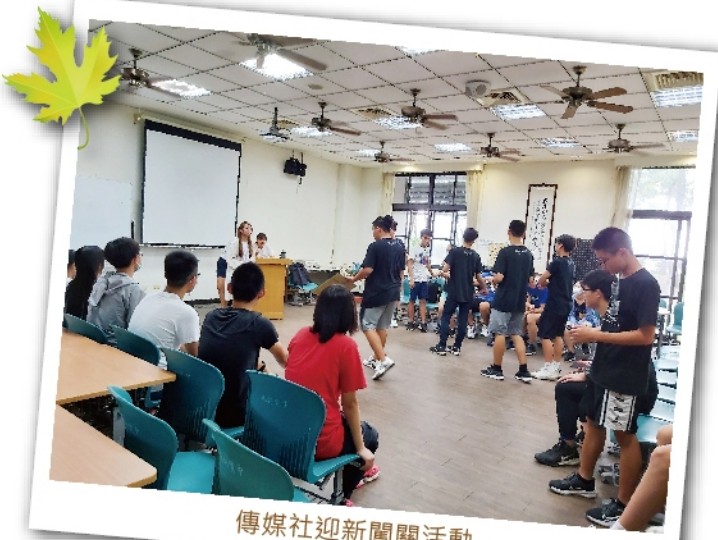
傳媒社迎新闖關活動