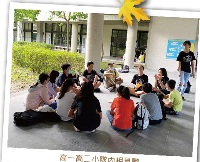
高一高二小隊內相見歡