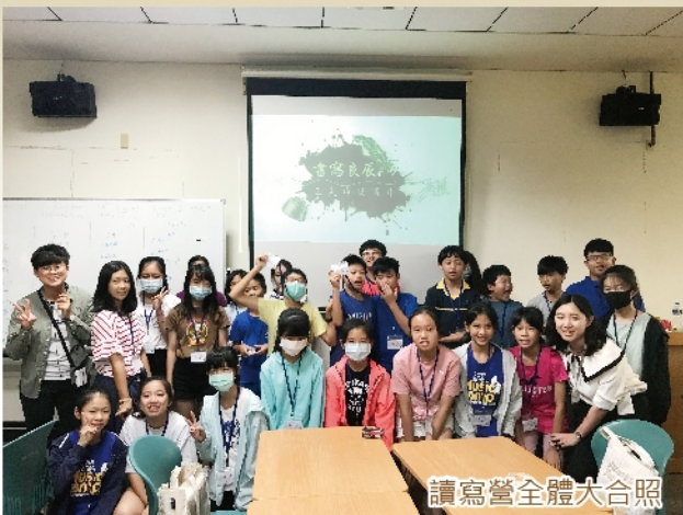
讀寫營全體大合照

伴隨著窗外的細雨聲，一場全新且未知的文學之旅啟程了。我們由火柴棒與落葉談起，說起賣火柴小女孩手中那根火柴棒是如