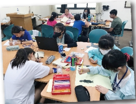
同步創作立體書及分享投影片