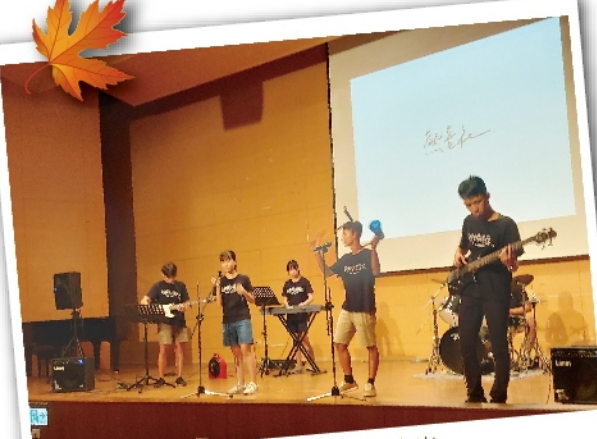
熱音社社團招生演出