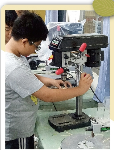
同學利用鑽床幫材料鑽洞