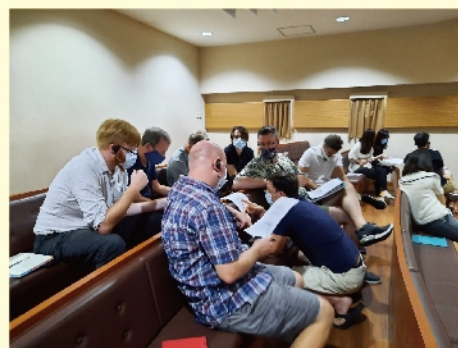
老師們在研習時分組討論