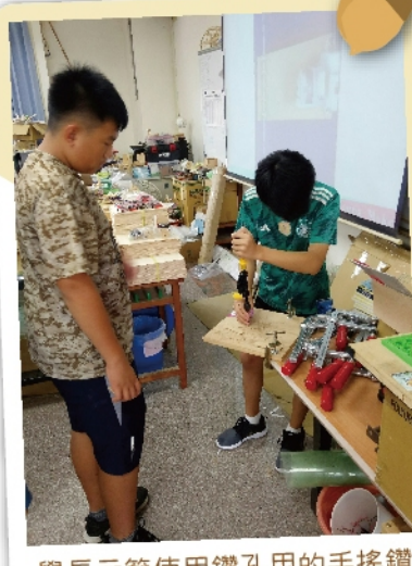
學長示範使用鑽孔用的手搖鑽