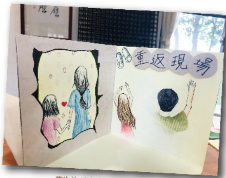
製作精美的立體書

三天扎實的營隊，孩子們將腦力榨乾，寫出一個又一個精采絕倫的故事，製作出了一本又一本精美的立體書。書寫良辰，正是時候寫作，想要書寫的此時此刻，就是書寫的良辰吉時。