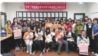
技藝班-九年級學生職場參訪