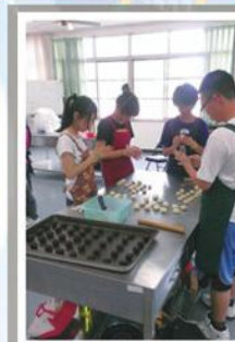
技藝班-食品職群上課情形