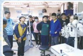
技藝班-八年級科大多參訪