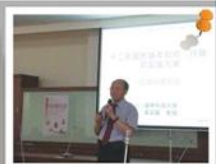
技藝班-對全校教師進行技職教育宣導