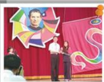
技藝班-全市技藝競賽頒獎