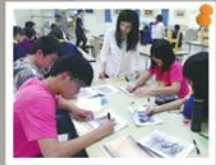
技藝班-高管職群上課情形