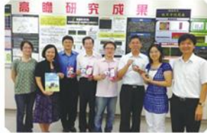
▲ 圖二：本校接受高瞻計畫外部評鑑