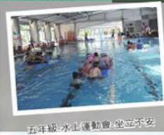
五年級-水上運動會-坐立不安

及穩定度；三、四年級競賽則強調團隊合作默契；五、六年級除了團隊合作默契外，個人技能的自我突破往往是班級致勝的關鍵。孩子們由小一~小六一路上來，在體育課中學習這些課程與技能，不僅可以展現運動的「力」與「美」，班際競賽更是孩子們體育教學成果展現的舞台，感謝健體領域老師們絞盡腦汁的規劃與設計，才能順利落實於體育教學中，看到班級導師們頂著烈日指導學生戰術、孩子們揮著的是汗水加淚水、家長蒞臨現場指導與鼓勵、行政科任的老師們支援賽事裁判…等，國小部師生在這項活動中全體動起來了，您感受到這股熱力了嗎？為了豐富孩子的團體競賽經驗，我們會讓這股熱力無限延續。