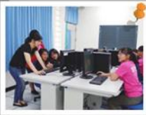
技藝班-高管職群上課情形