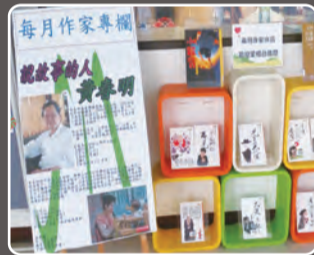
5月份作家專區—黃春明