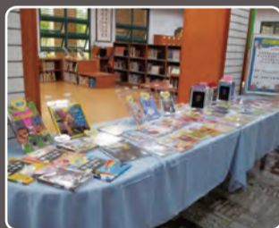
兒童分館4月新書展