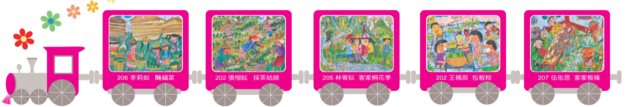
206 李莉如 醃福菜