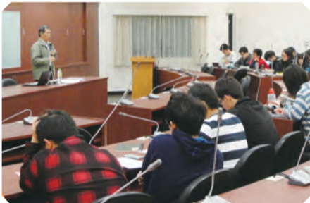
▲ 先專心聆聽教授所講的面試技巧