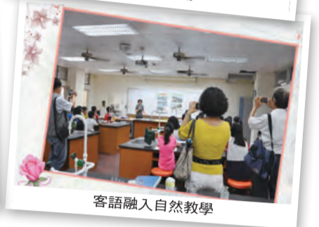
客語融入自然教學