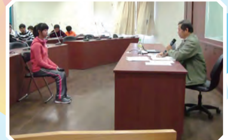
▲ 志願同學上台面試演練示範