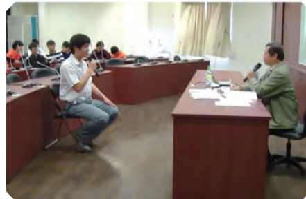
▲ 志願同學上台面試演練示範