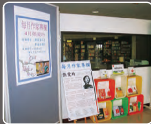
4月份作家專區—張愛玲