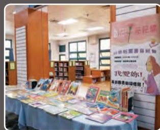
馨花朵朵開 母親節主題書展