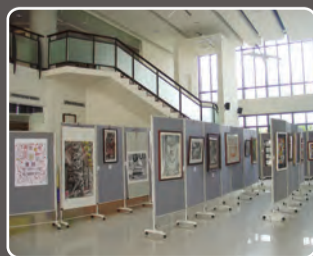
民德國中美術班作品展