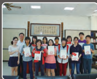
第四屆撰實文學獎得獎同學及 校長指導老師合照