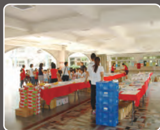
4月份國小兒童優良圖書展 (彙豪書展)