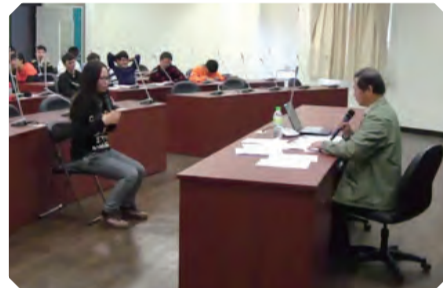
▲ 志願同學上台面試演練示範