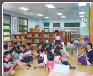
4月故事媽媽為兒童們說故事