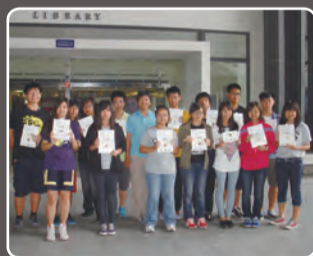
主任與三魚網讀書心得獲獎同學合影