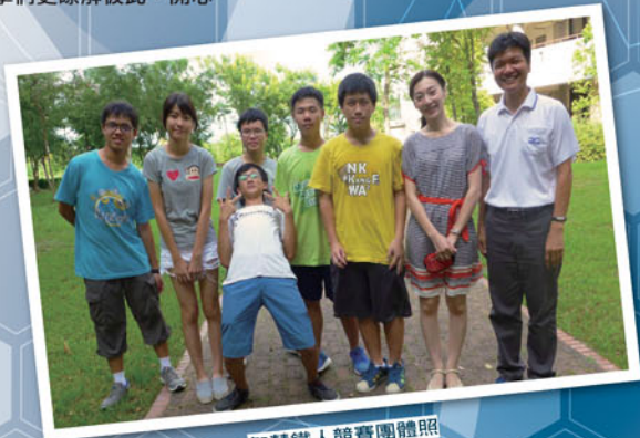
智慧鐵人競賽團體照