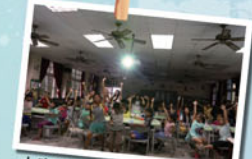
大家超級踴躍的要表現一下

沒想到這次的夏令營竟是我高中畢業前最後一個，但它更是最深刻的一次經驗。這次活動與以往的課程並無不同，但因為參與同學的不同和報名的孩子不一樣，以及令人難以忘懷的艱辛過程而讓這次的夏令營與眾不同。