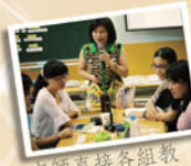
老師直接各組教學，有問題第一時間解決