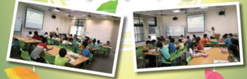
給本賞析與讀後心靈的交織共鳴