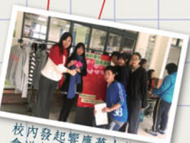
校內發起響應華山基金會送年菜給獨居老人活動，提升師生關懷品格