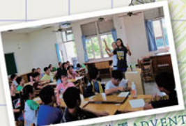
2014國中、部與美國ADVENT團隊(「忠」志願教導英文的「美國人」)共同舉辦了英文品格營，結合英語會話與品格教育，強調誠實、勇氣、寬恕和同情等重要品格