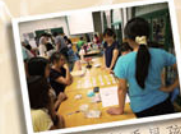
從句子重組看見孩子的想法