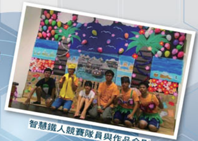
智慧鐵人競賽隊員與作品合影