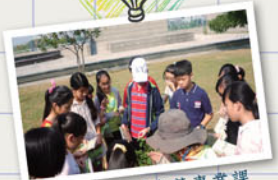
透過環境探索營專業課程帶領學童認識生活周遭的環境養成愛物惜物的感恩品格