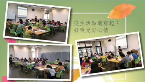
從生活點滴寫起：好時光好心情