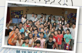
雙語部扶少團服務偏鄉與學員大合照