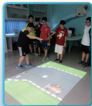
遠東科大：多媒體互動遊戲