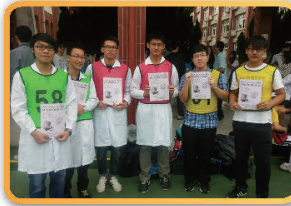
參加學科能力競賽的同學們神采奕奕志在必得

南科實中是一所一直在進步中的學校，今年的學科競賽總成績已是南區各校中的翹楚，也是學校歷年來成績最好的一次，學長姊的優良表現，在在激勵著學弟妹前進的動力，我們期待下一屆的同學能夠勇於接受挑戰，為學校榮譽、個人榮譽再創輝煌。