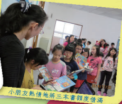
小朋友熱情地將三本書踴躍借出