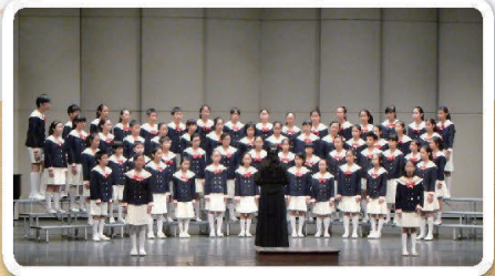
103年台南市音樂比賽同聲合唱特優進軍全國