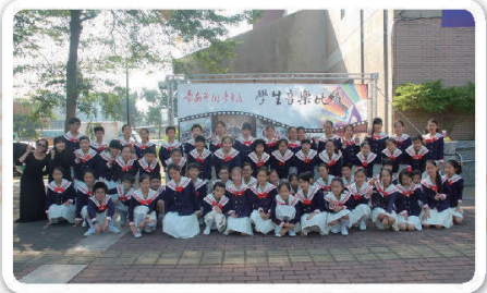
103年音樂比賽入場前合照

因為我們的努力，讓我們被外界看到了，今年12月30將受邀於美國晶晶合唱團一起在樹谷音樂廳聯演。合唱團的孩子們會繼續在舞台上發光發熱，明年3月全國音樂比賽我們也會全力以赴，為校爭光，也為自己留下一筆人生光榮紀錄，合唱在孩子心中種下的一顆音樂種子，將逐漸發芽。