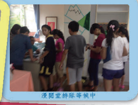
漫閱室排隊等候中