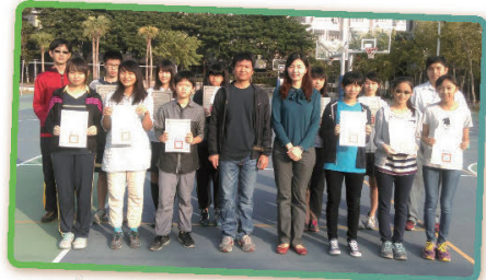
參加103學年台南市美術比賽成績優異同學

校慶活動期間，教務處辦理靜態教學成果展，而學生在其他各項比賽表現中也都表現優異，將代表台南市參加全國比賽。美術比賽方面，高中組水墨畫、國中組西畫類及漫畫類分別榮獲臺南市的第二名及第三名。音樂比賽方面，高中部管樂團方成軍不到一年氣勢非凡，勇奪台南市特優第一名，國中部管樂團也獲得特優；國中部合唱團初試啼聲，則不同凡響，獲得鄉土歌謠組第一名。