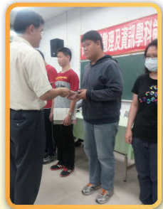
羅宇志同學(中)榮獲物理科佳作