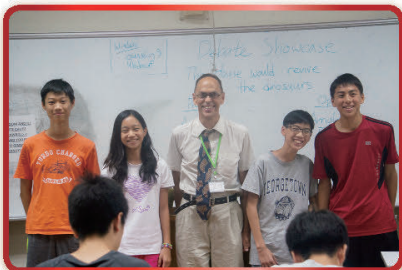
辯論營隊學員進行模擬賽程