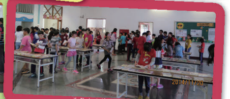
井然有序的排隊借書人潮

2014年是個豐富的閱讀年。國資總館全年共採購2578本新書，兒童分館分佔1203本，DVD影集共42片。本館以每月進書的方式跟上新書出版的快速腳步，將最新的概念與訊息及時滿足讀者們閱讀的渴望。為了積極推廣新書的利用率，每月辦理新書展示供讀者當鮮預約，新書上架後也不急下架，先放置於新書專區供讀者優先利用。