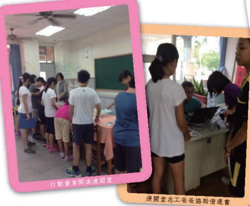
行前書車開進校園