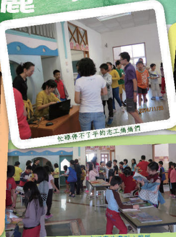
小朋友認真挑選書耐心排隊