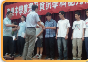
葉皇毅同學(中)榮獲資訊科第六名