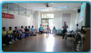
中正預校教官宣導