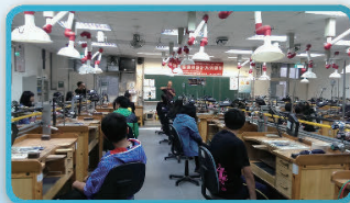
台南應用科大：設計系