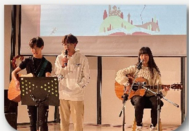
充滿文青氣息的彈唱表演