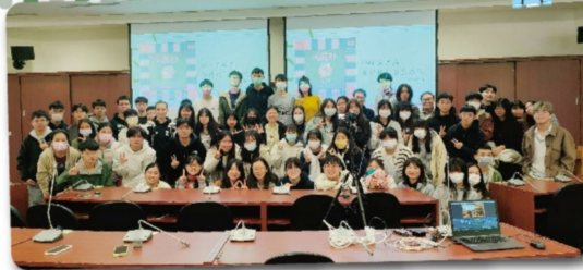
第二天上午場次會後大合照