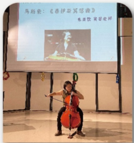
農歡老師的大提琴悠揚樂音療癒人心