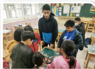
桌遊融入英語教學