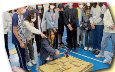
larger than life製作完成與試玩