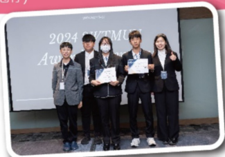
參與會議的南科社員以雙代形式榮獲會議中唯二的Outstanding delegate獎項