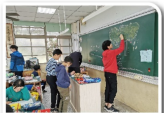
上午課程-美術植物作品