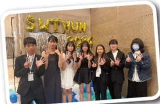
參與寒訓之學員及幹部合影

參與模擬聯合國，我不僅學會了演講、辯論和問題解決的技巧，還培養了跨文化和語言溝通能力。透過模擬現實世界的問題，我們更深入地了解了國際政治和全球議題，以及各國的立場，擴大了全球視野。在lobbying time時，我們發展了團隊合作的精神，展現了分析問題和提出解決方案的能力。在與來自不同文化和背景的同學討論的過程中，我學會了尊重和理解不同觀點。這次寒訓經驗對我來說十分珍貴，是我第一次在這麼多人面前用英文演講。前一天晚上我特別緊張，一直重複練習語速、發音和咬字，幸好最終結果令人滿意。期望這寶貴的經驗能成為我未來的一大助力。