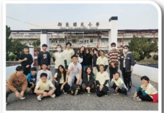
21名扶少團團員參與新東國小冬令營