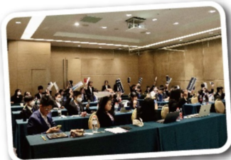
代表們在會議期間舉起國家牌為自己的國家爭取發言機會