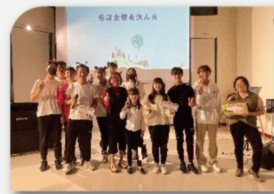
感謝所有的表演者