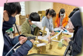
rockin' roller coaster課程製作