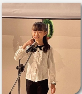
生動活潑的說故事表演