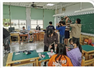
上午課程-科學挑戰

在體育活動部分，學生們學習了抓旗子(Capture the flag)、足球、足壘球及躲避飛盤。抓旗子對於台灣學生來說相對陌生，分成兩隊，試圖入侵對方的領域並奪回己方旗子為獲勝條件。大地遊戲介紹了8種不同的小遊戲和挑戰，每個活動都以英文進行，有些活動學生們本來就知道玩法，只是需要在闖關中說出英語的關鍵字或完成與英語相關的指令，對學生來說也很容易上手。