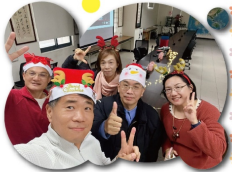
校長(右二)祝大家平安快樂!

在新的學期，我們期待大家繼續保持學習的熱情，努力地成長進步。且讓我們一起在學校的學習中，拓展視野，展望未來；一起在各項活動中，懷抱信心，面對挑戰。祝福大家新學期順利！