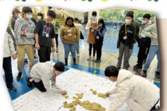
larger than life玩成交換組別試玩