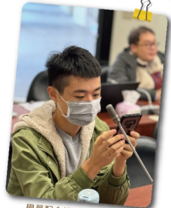
學員配合講師進行APP互動

在這兩天的活動期間，校友團隊邀請了各類組代表科系，包括心理系、戲劇系、法律系、職治系、醫技系、資工系、機械系、地科系等，學長姐們除了分享每個學校的特色、科系必修的科目學分外，更重要的是分享在經過大學期間的種種歷練，未來的就業出路、繼續升學碩士班等管道有哪些選擇，甚至有珍貴的出國交換經驗分享，給予求學中的學弟妹們一些指引方向，更了解這些科系在學什麼，是否真的適合自己。在眾多場次的分享中，許多講者都提及「擇其所愛，愛其所擇」，這是最重要的核心精神，未來不管選擇了哪個校系就讀，都要從中學習、充實自己，讓自己更加分。