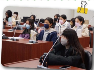
專心聽講的學員們