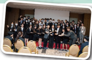
南12校模聯聯合寒訓在所有人的不懈努力下完美落幕