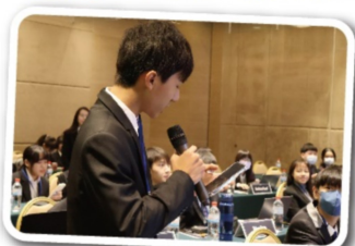
COW環節直接地與他國代表進行辯論

在我真正接觸模聯社之前一直認為，模聯？不就是用英文上去說說話就好了嗎？直到聽到模聯的介紹，我才發現還有好多跟我想的不一樣，我也決定要更深入的了解之。