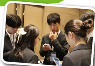
在lobbying time與他國代表交流