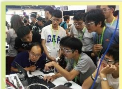
老師及學生投入的討論C++程式的指令設計及想法