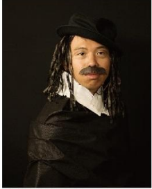
▲哈爾斯自畫像 213周易霆扮演