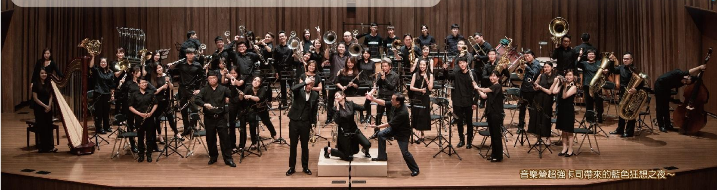
音樂營超強卡司帶來的藍色狂想之夜~