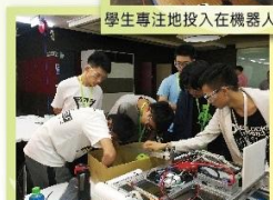
與協同中學的輔導員討論機器人手臂的設計