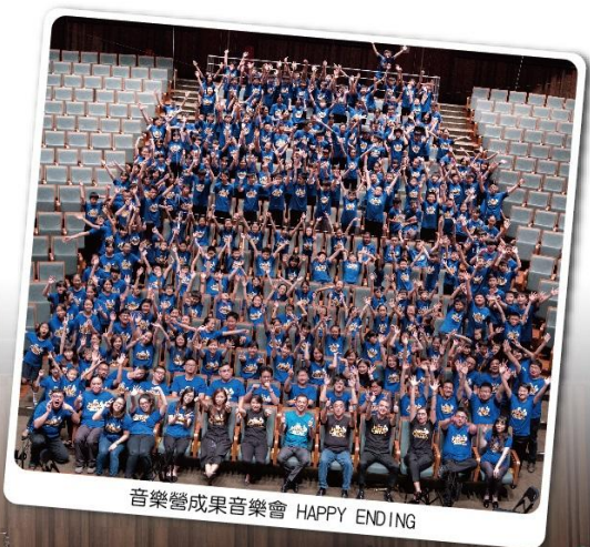
音樂營成果音樂會 HAPPY ENDING

管樂團的孩子們總是期待著樂團暑假安排的各種音樂之旅及活動~今年安排了6天5夜「趣淘漫旅」曾文水庫探索園區的移地練習、為期25天美加音樂營知性之旅，以及最後暑假尾聲在學校的7天精華音樂營，充實緊湊的行程讓孩子們在暑假擁有美好的回憶!讓人開始期待明年法國西班牙歐洲巡演了~想和我們一起來趟音樂知性饗宴?讓孩子加入我們就對囉!