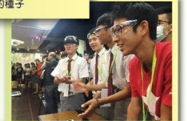
學生專注地投入在機器人任務競賽活動