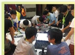
師生分工著手進行機器人實作及程式指令測試討論