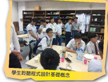
學生聆聽程式設計基礎概念