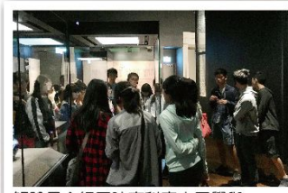
解說員介紹同時南科實中同學與大學外籍生討論及解說