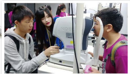
視光系操作驗光儀器設備體驗