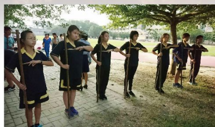
執棍禮，也不簡單呢！

此次入團訓最主要的活動目的為充實群體生活知能及童軍的基本認知。藉由小隊精神特色，能使一個小隊對於所需承擔的任務，都能表現得負責且熱心有活力，並從中學習領導別人與被領導。考驗內容有：小隊隊呼、歌唱、團康遊戲、實踐童軍技能、童軍禮節、急救術