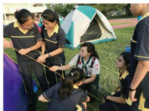
為了今晚的家而奮鬥者

學員們期待已久的兩天一夜，六校聯合童軍入團訓大露營終於來臨，時間106年10月28日~10月29日，地點：南新國中。今年參與的學校有：國立南科國際實驗高級中學、金城國中、新東國中、南新國中、永康國中、歸仁國中，共有團長、隊輔、服務員、團隊人員近300人參與此盛會。本學期南科實中童軍社團共有34人，參與兩天一夜入團訓考驗營有30人，可說是參與度極高、相當熱烈，此次參與30人全數通過初級考驗取得證書，表現非常優異。能通過初級考驗是身為一位童子軍的基本門檻，通過初級考驗後才能正式入團宣示及佩戴領巾，正式成為童軍團的一份子，往後才能穿上跟教官近似的帥帥制服，象徵著榮耀與模範。在這兩天一夜當中，時間課程活動安排非常緊湊紮實，學員們無不戰戰兢兢的努力學