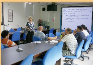
WASC PD, Teachers talks about Expected Learning Outcomes