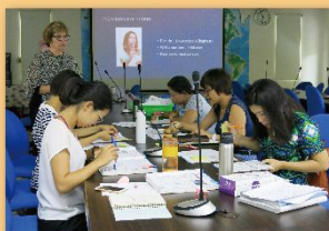
WASC PD, Teachers talked about Learning standards