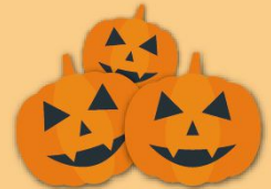
IBST students line up to compete for best costume during the Halloween celebration