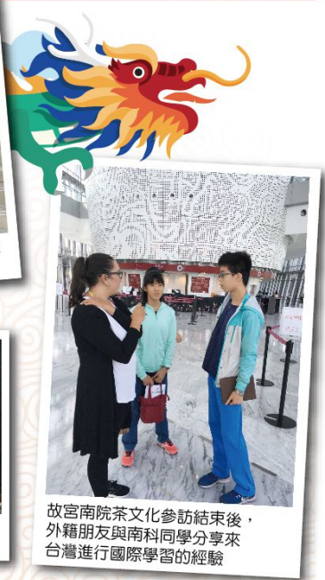
故宮南院茶文化參訪結束後，外籍朋友與南科同學分享來台灣進行國際學習的經驗