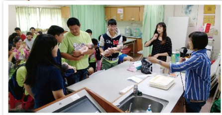
幼保科體驗嬰兒照顧技巧

在一整天的行程中，學生收穫很多。學生透過學習單表示，操作儀器很有趣，能讓自己看起來很專業。有些學生寫道，寵物美容能接觸到小狗，是最療癒的科系。有些學生則說，參訪後對未來想選的科系有一點概念和方向。從滿滿的學習單中，可以看見學生在這次體驗活動中，學到很多知識，也因此加深了對科系的了解，深具意義。