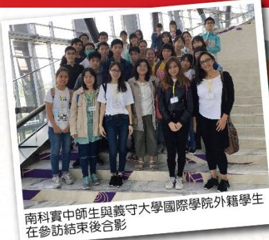
南科實中師生與義守大學國際學院外籍學生在參訪結束後合影