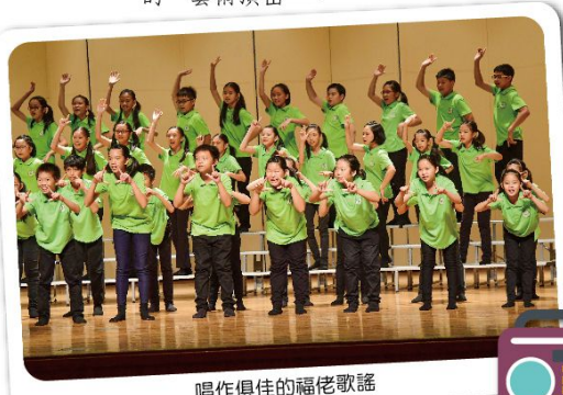
唱作俱佳的福佬歌謠