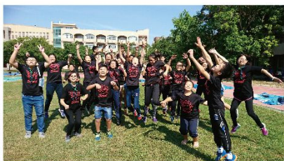
圓滿歸師前的開心大合照