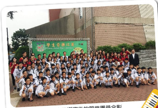
精彩音樂賽宴後的管樂團員合影

三項市賽特優第一的榮耀帶給我們的感動～是喜歡音樂、喜歡歌唱的孩子聚在一起“表演”，呈現給大家的則是完美的“藝術演出”。