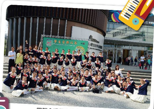
同聲合唱師生化身爵士小歌手載歌載舞