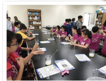
製劑製造工程系 體驗防蚊液製作