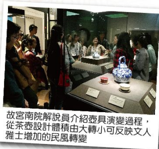
故宮南院解說員介紹茶具演變過程，從茶具設計體積由大轉小可反映文人雅士增加的民風轉變

分享。本次交流活動由英文科孫筱菁老師於活動前在國際數理班課程利用TED短講影片，提升同學英文聽力及口說進行，並規劃進行南科學生TED短講，提升英文口說，同時搭配英文研究方法課程中學生將同學為茶文化進行的研究與探討，設計製作的茶文化介紹英文小書與外籍朋友分享。