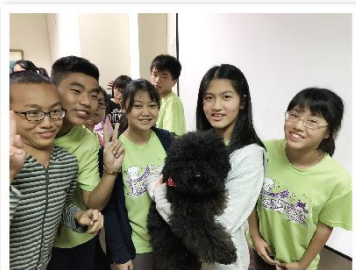
寵物美容科體驗寵物的訓練技巧