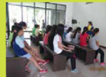
學生志工專心聽講中