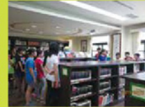
西文書庫順架說明