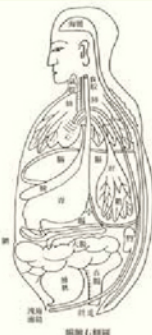
圖1 明代存真圖中國

作者：張之傑 文：閱讀教師黃懷萱 風景文化出版 本校館藏索書號 附圖：節錄自本書第55、58頁 901.1/1132