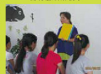
志工團副團長兼總團組長 美如阿斌培訓學生志工