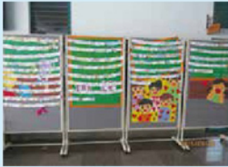
兒童分館教師卡活動