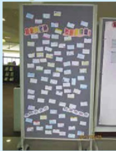
圖資總館教師卡活動