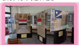
新住民國旗海報獲得特優的三組作品