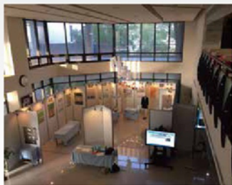
專題靜態成果展在圖書館總圖進行 讓學生可以觀摩彼此作品