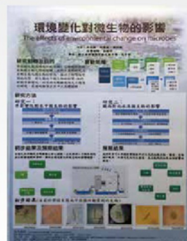
生物專題以南科著名的生態池進行 環境變化對微生物的影響研究