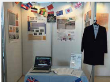
模擬聯合國專題呈現國際交流的異國文化