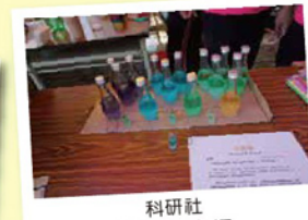
科研社 有趣的天氣瓶