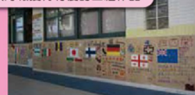
各組的海報都非常豐富精美