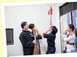
粉墨登場的南科四俠~~尖叫