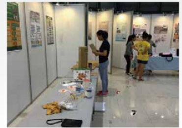
學生利用放學時間自動自發到圖書館進行佈展

南科校園是一個多面向的環境，除了讓學生學術方面的學習外，更重要的還有學習合作、協調、包容和承擔責任…專籌的副召在回憶這一路的心路歷程時說：「從策劃到執行，從緊張到期盼，從迷茫到展覽落幕……中間或許並不順遂，但大家一同攜手度過，有停擺、有向前，有蹲下、有站立。面對許多的未知，仍確定的是會抱持初衷，成就更多感動。酸、甜、苦、辣，五味繁雜，觸動心頭的是專題籌備會的悸動。107NKPC會繼續挑戰…」