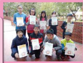
總共有9個小組獲得名次