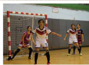
▼ 新訓練的三位守門員