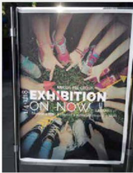
NKPC為專題成果展製作宣傳海報 展出日期1/4-1/18