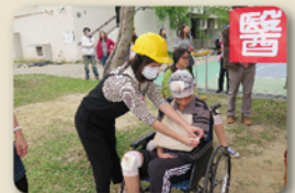
地震受傷簡易救護