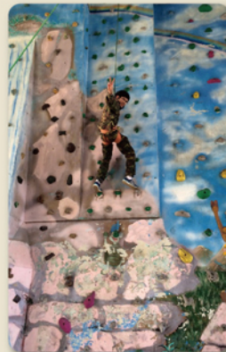
無畏恐懼 我愛攀岩課程