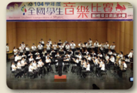
管樂合奏全國決賽再奪特優