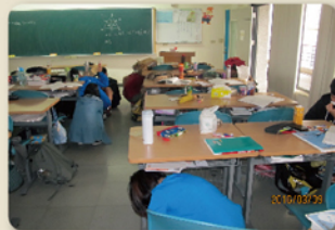
地震來臨時保護好頭部