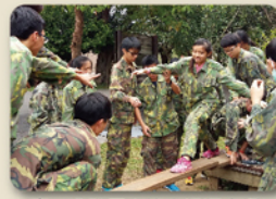
高一公訓同心協力過獨木橋

在這所瀟灑學術研究氣息更濃的校園裡，管樂團更傳來造成歡聲雷動的好成績，在管樂合奏南區決賽中連續三年榮獲國小組、國中組、高中組特優以及高、國中銅管五重奏優等的佳績，令人讚嘆！ 走在這所多元的校園中，你會看到網球隊、合唱團、田徑隊同學們為全國大賽緊鑼密鼓地準備著。讓我們為他們加油打氣吧！