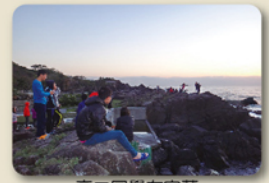
高二同學在宜蘭東森海洋遠眺晨曦