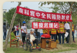
防災演練醫療站架設