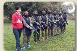
漆彈大對決準備開打