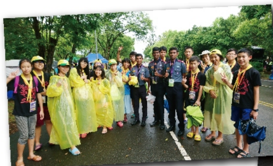
童軍活動國際交流