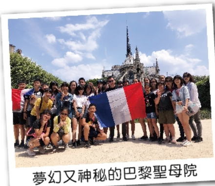
夢幻又神秘的巴黎聖母院