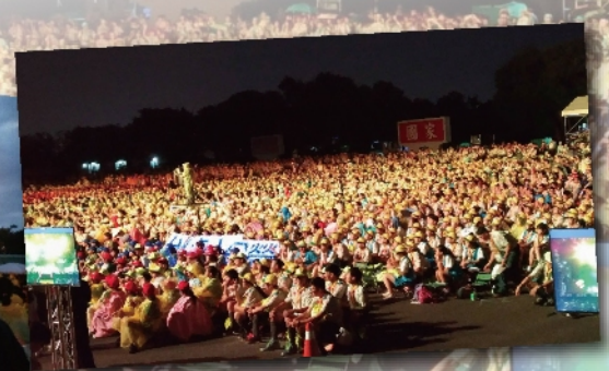
成功嶺有1萬2千名童軍參與活動