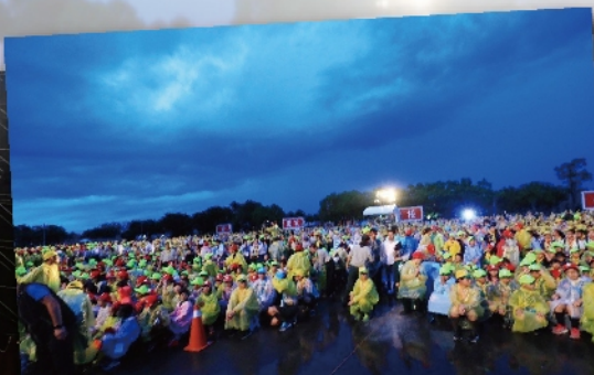
全國大露營在成功嶺有1萬2千名童軍參與活動