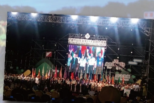
中華民國童軍第11次全國大露營在成功嶺開幕典禮

各團分營在成功嶺各區現場搭起帳棚及創意營門，雖然夏季十分高溫，有時一下子又有傾盆大雨，但童子軍們期待活動的露營心情仍超開心的。經過這7天6夜的相聚，雖然每天都伴隨著小雨、大雨不間斷，豐富的活動仍澆不熄青少年的學習熱情，這場活動在成功嶺集訓，將成為童軍夥伴在人生中難忘的特殊記憶。