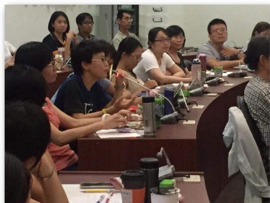
與會教師熱烈討論和分享OECD所提出學童該學到的真實能力三天面向