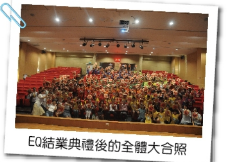
EQ結業典禮後的全體大合照

「人文心、關懷情」是我在南科實中成立的第一年給自己在教學上的期許，期盼自己在南科這片土地上，以此為目標，盡己之力來灌溉這片教育淨土，讓南科的孩子都能擁有一顆瞭解自我、尊重他人、關懷世界的心。