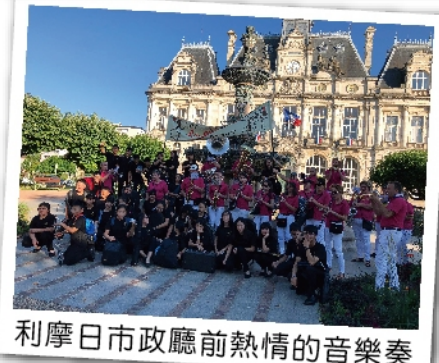
利摩日市政廳前熱情的音樂奏