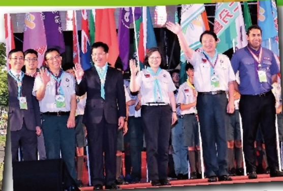
總統蔡英文著童軍裝，宣布中華民國童軍第11次全國大露營在成功嶺正式展開

睽違7年之久的中華民國童軍第11次全國大露營，活動時間6月30日至7月6日，共匯聚17國、1萬2千名童軍一起歡唱童軍歌，7月1日在台中市成功嶺陸軍營區舉行開幕典禮。同時，蔡英文總統也同來一起參加開幕典禮晚會，童軍們實為感到無比特殊的榮耀，童軍活動一直是兒童、青少年非常重要的人格養成教育。