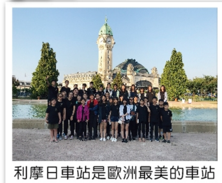
利摩日車站是歐洲最美的車站