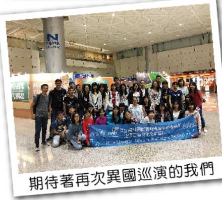
期待著再次異國巡演的我們