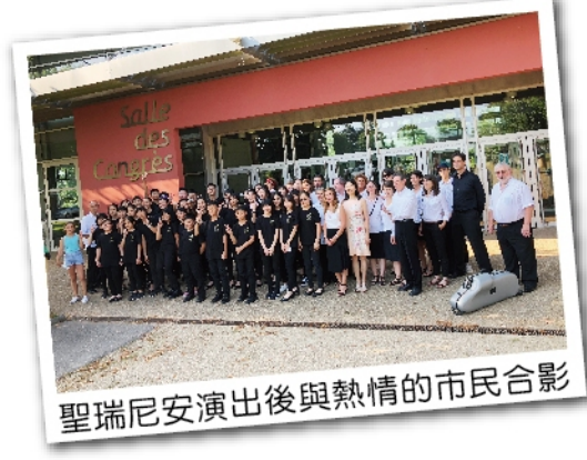
聖瑞尼安演出後與熱情的市民合影

巡迴演出活動後，樂團前往巴黎，剛好遇上法國國慶及世界杯足球賽冠軍，法國人民瘋狂的慶祝，也讓來自台灣的我們深刻感受到法式浪漫與熱情。期待下次的文化巡演之旅～～