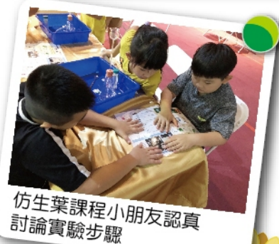
仿生葉課程小朋友認真討論實驗步驟