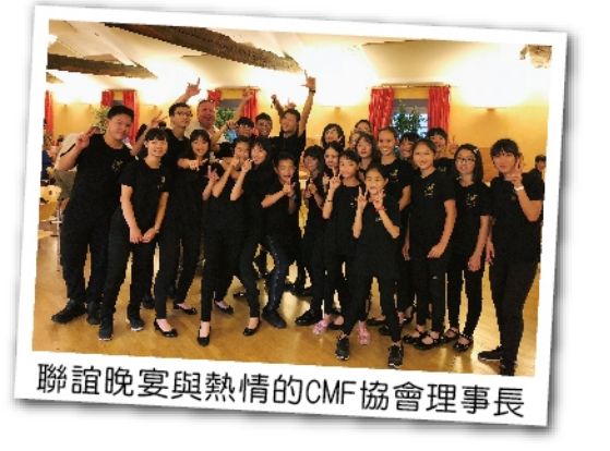
聯誼晚宴與熱情的CMF協會理事長