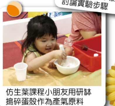
仿生葉課程小朋友用研鉢搗碎蛋殼作為產氣原料