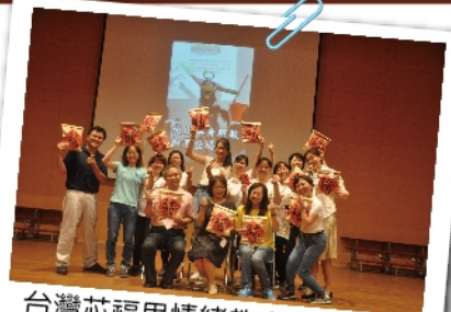
台灣芯福里情緒教育推廣協會EQ志工大合照