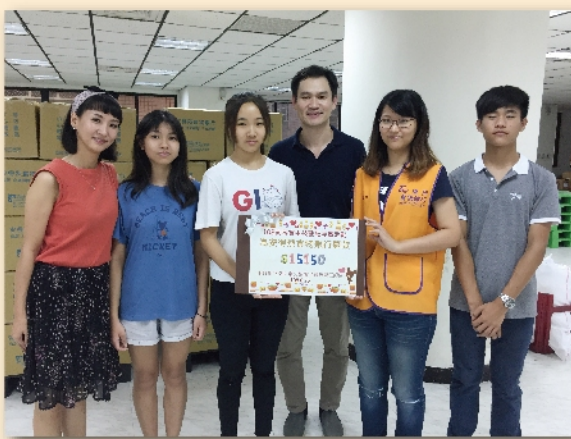
技藝班學生將義賣款項送至安得烈食物銀行