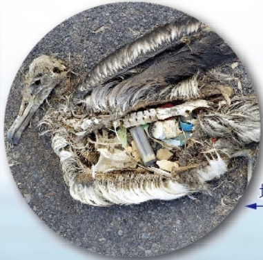
誤食塑膠垃圾的信天翁