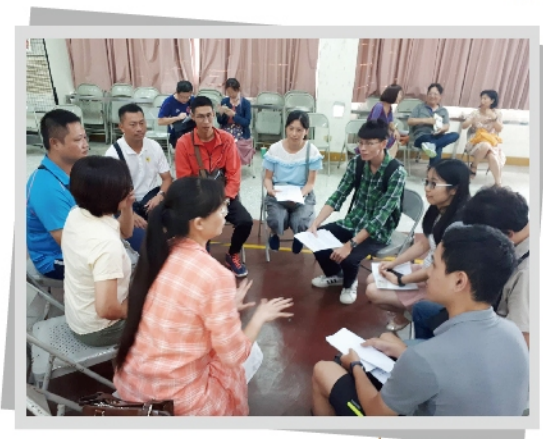
分發現場與新進教室相見歡