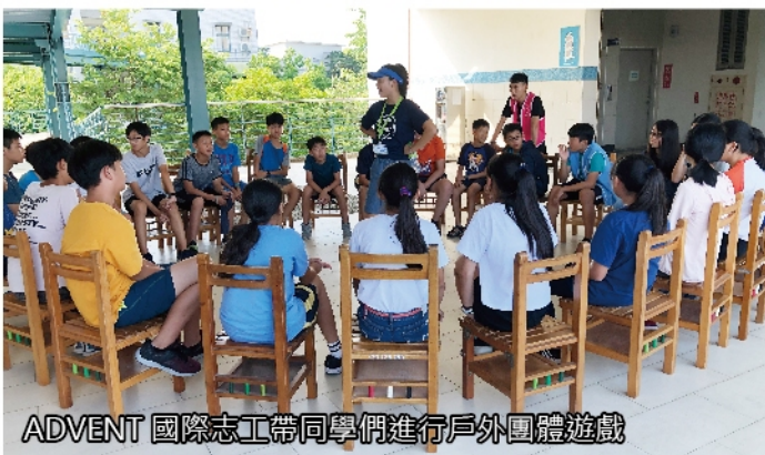
ADVENT 國際志工帶同學們進行戶外團體遊戲