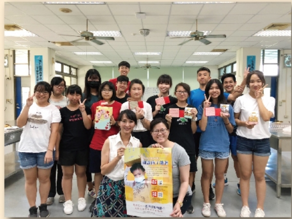
技藝班食品職群學生與指導老師響應安得烈食物銀行募款活動