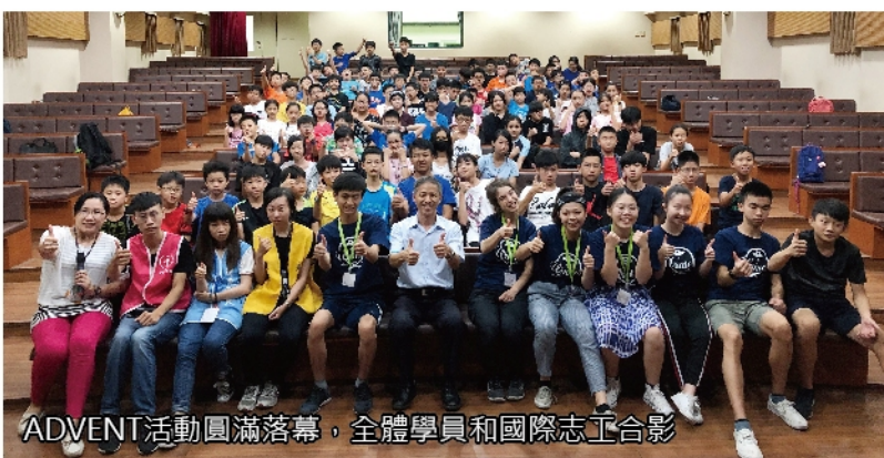
ADVENT活動圓滿落幕，全體學員和國際志工合影

仿生機械獸營隊是讓同學自行設計、動手切割結合電子零件作出仿造生物行走的機械獸，落實國家推動的STEAM教育政策。程式設計營則以microbit、scratch進階及APP inventor為三大主軸，培養同學邏輯運算思維能力，接軌新課綱的資訊科技素養。