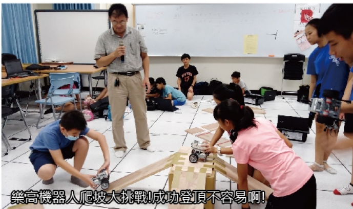
樂高機器人爬坡大挑戰!成功登頂不容易啊!