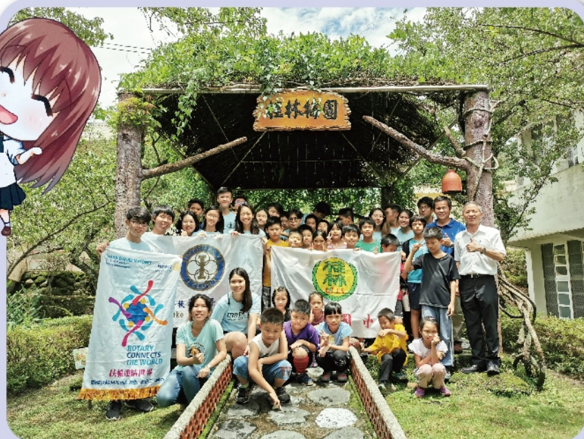
南科實中扶少團及桂林國小大合照