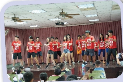
南科實中扶少團舞蹈表演