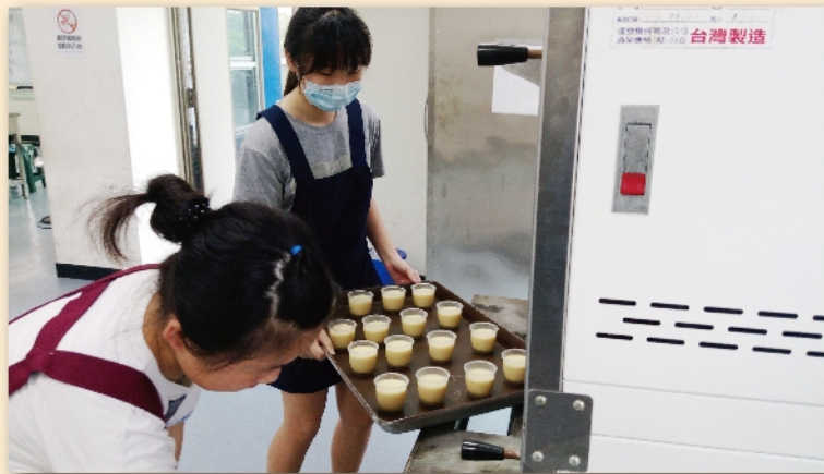
技藝班學生製作烤布丁