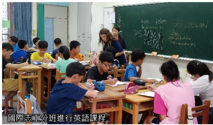
國際志工分班進行英語課程