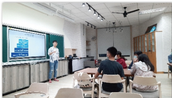
中興大學企管系益誠分享