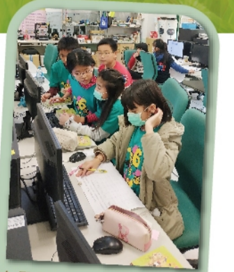
在電腦教室整理資料，並利用圖書館網站查找補充書籍的索書號以便到圖書室找出書籍

處處飄滿書香、濃濃的同學合作情誼，是校園中最美的風景。學生們回饋說：體驗到閱讀原來是這麼有趣，也學到了不同的閱讀策略及分工合作，收穫豐富。未來，期望這點燃的閱讀火花持續發光！