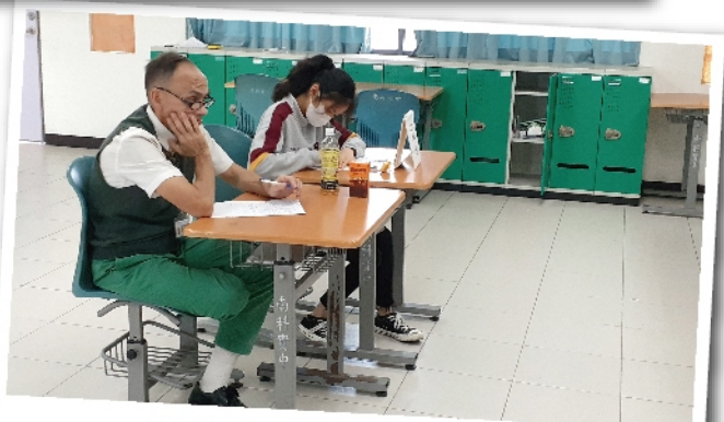
Dr.Fruit聚精會神聆聽學生辯論