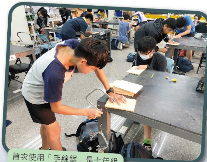
首次使用「手線鋸」是七年級學生的新鮮事，相當考驗技巧