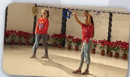
雙語部雙妹舞蹈表演