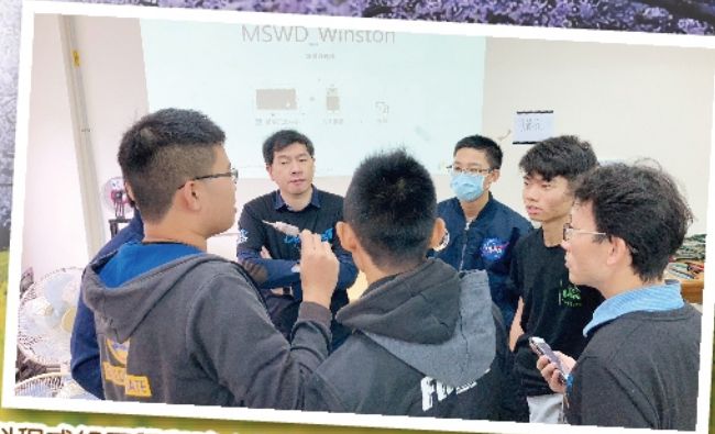
南科程式組同學與建中指導教授討論視覺辨識系統的環境架構