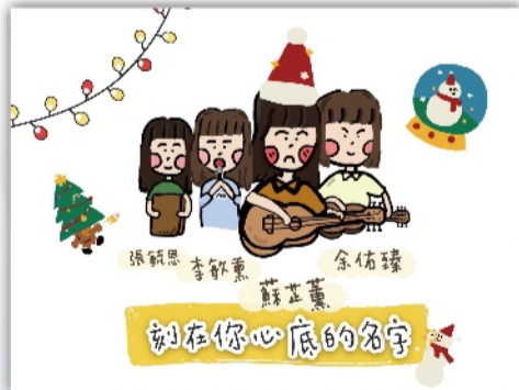
高中部學生自製宣傳簡報