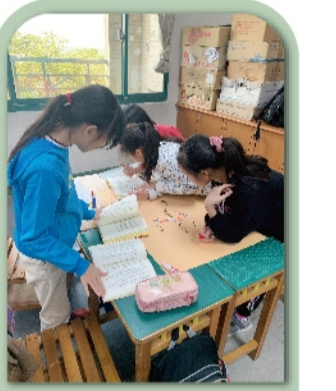
分工合作看書、討論、書寫答案，校園處處是書香