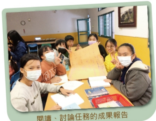
閱讀、討論任務的成果報告