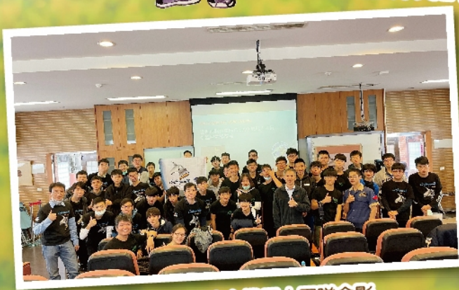
南科實中與建中機器人團隊合影