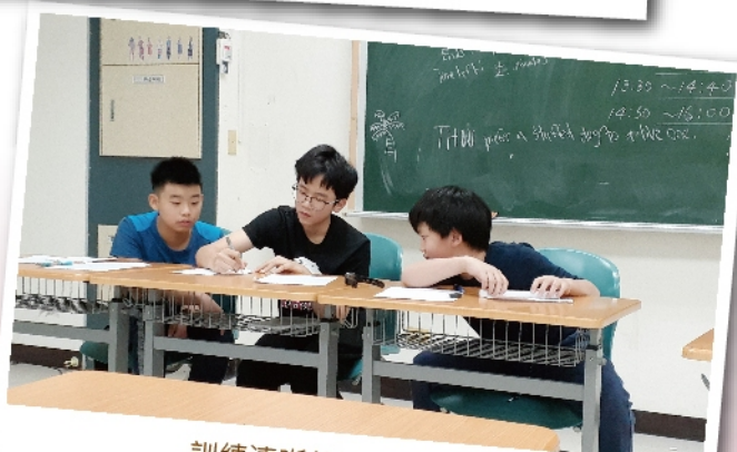
訓練清晰的邏輯思考能力