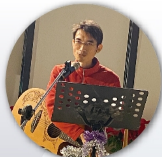
加奇老師吉他彈唱