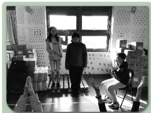
學生用平板拍的[記憶傳承人]的一幕：慶典儀式