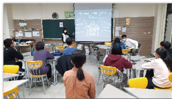
中國醫藥中醫系芯妤分享