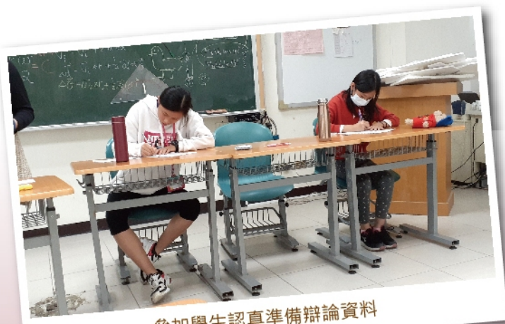
參加學生認真準備辯論資料

因此，這些全部都是辯論營存在的理由：解開迷思和打破青少年對自我能力認知的框架。除此之外，辯論營更是一種「傳承」：雖然主要指導的是老師，但每場辯論賽後實際給予評論與教導的，則是曾經也茫茫無知的辯論社團學長姐們。講評時，聽起來苛刻的他們，也是一路走來才知道辯論的困難，所說的一字一句都是基於對學弟妹的寄望。相信，經過五天的寒假英語辯論營，每一位參加的年輕辯士，都能領悟辯論的真諦並自信滿滿地站在未來的每一個舞臺上，大聲地宣告：「I am a debater!」