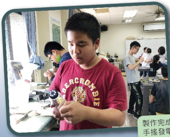
製作完成的手電筒必須經過手搖發電測試才算完成