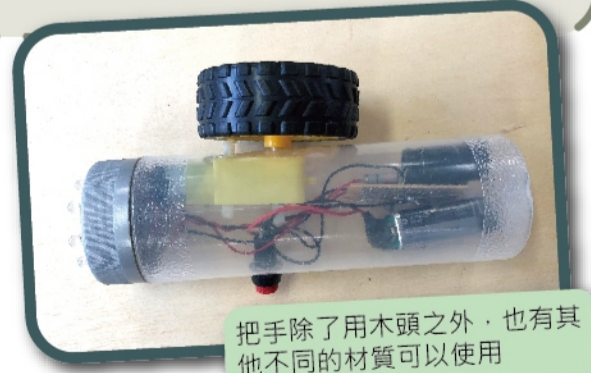
把手除了用木頭之外，也有其他不同的材質可以使用