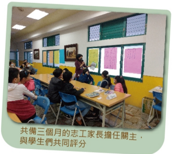
共備三個月的志工家長擔任關主，與學生們共同評分