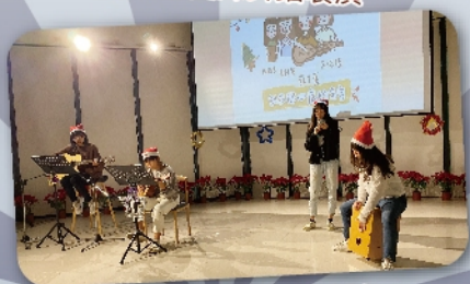
高中部學生彈唱表演