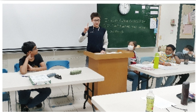
營隊中實際演練各種辯論模式