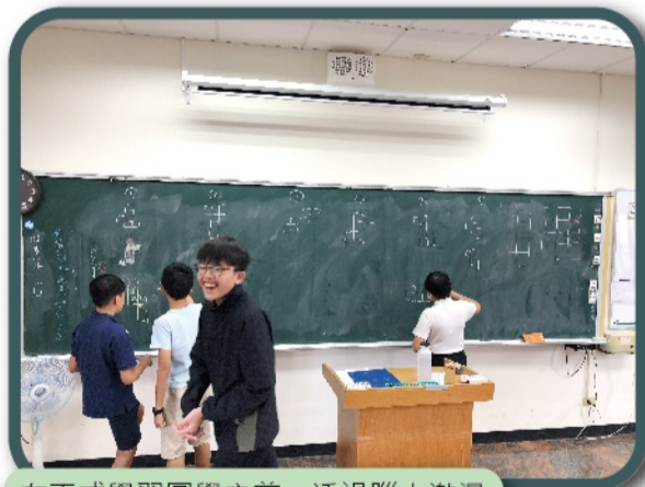
在正式學習圖學之前，透過腦力激盪想出多種可行的立方體展開圖

加工過程所用到的各種技巧都終將成為能夠帶走並實際運用的生活養分，從發現問題到動手解決問題，這些挑戰與體驗都將讓我們更加認識自己的天賦，並且在未來更加廣闊的翱翔。