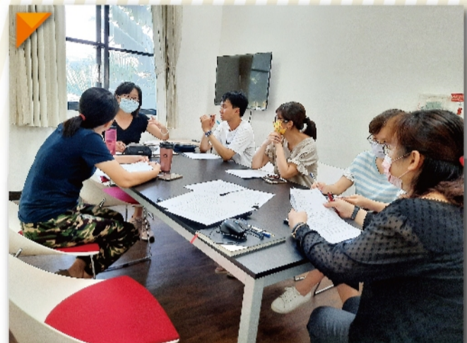
校歌歌詞共創小組第一次會議