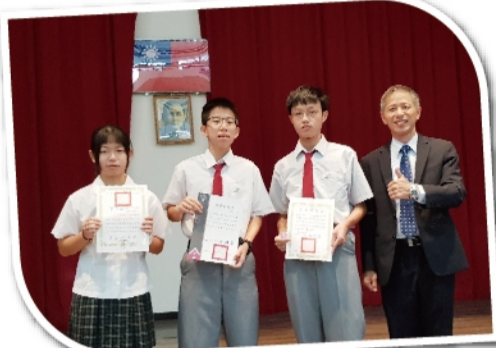
109學科能力競賽 生物榮獲第四， 資訊、物理榮獲佳作