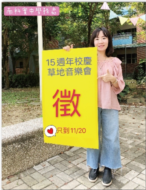
學務主任替草地音樂會宣傳

「南科十五，拾穗綺舞」為慶祝創校15週年，今年校慶以「豐收、薪傳」為題，將於12月5日盛大展開！今年延續綠色愛地球的精神，落實「零垃圾」減塑環保創意市集，同時推出草地音樂會，要在藍天白雲下，作夥享受音樂、美食交織的盛典。