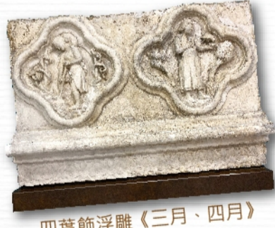
四葉飾浮雕《三月、四月》