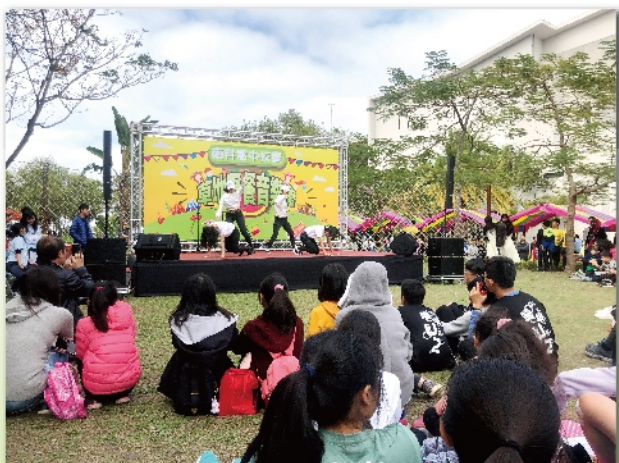
草地音樂會今年再度登場