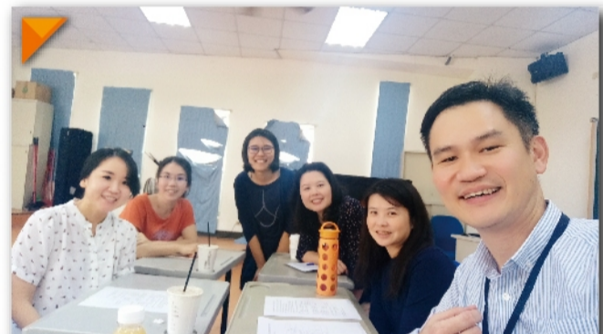
音樂教師籌備小組第一次會議