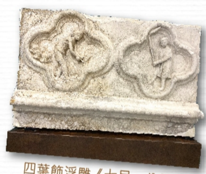
四葉飾浮雕《七月、八月》