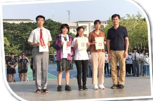
109 台南市國語文競賽榮獲佳績