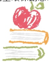
延續去年的減塑環保市集精神

被喻為「文青歌手搖籃」的草地音樂會，更是今年校慶的一大亮點。想像在藍天、白雲與綠地上，吹著冬風、吃著熱食，享受各部帶來的精彩演出，絕對是一大享宴！更重要的是，還有抽獎活動！您有明星夢嗎？快來報名草地音樂會，大展長才吧。