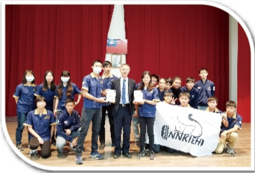
本校榮獲2020FRC 世界機器人大賽 台灣區區域聯盟冠軍及最佳評審獎