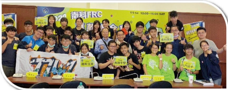
M5 2020FRC工程筆記暨募款企劃競賽 本校6998榮獲冠軍

「春耕、夏耘、秋收、冬藏」，年度進入11月，正是秋收的好時節。高中部的師生經過又一年的努力耕耘，在各項學習領域紛紛收獲好成績，令人欣喜雀躍。