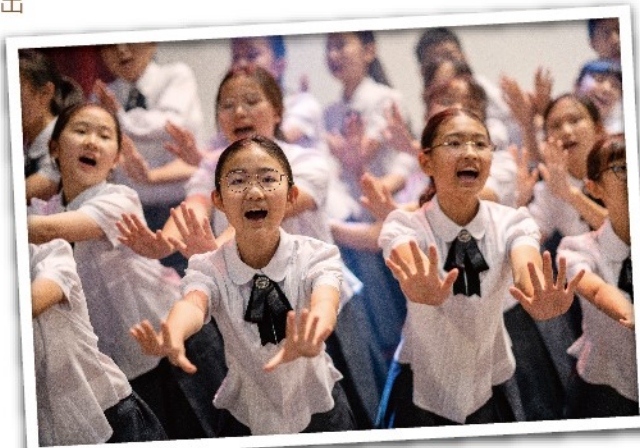
國中合唱團的演出