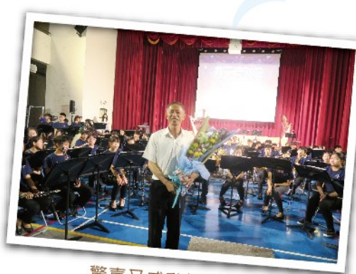
驚喜又感動的秦校長