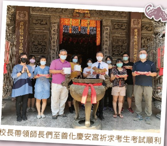
校長帶領師長們至善化慶安宮祈求考生考試順利