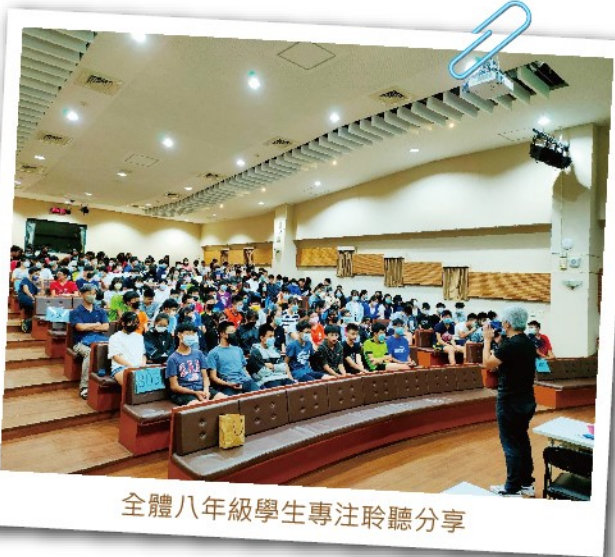
全體八年級學生專注聆聽分享