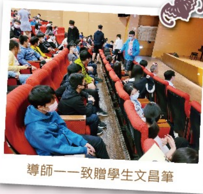
導師一一贈學生文昌筆