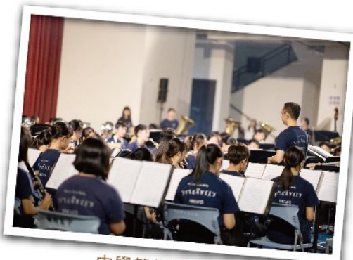
中學管樂團的演出