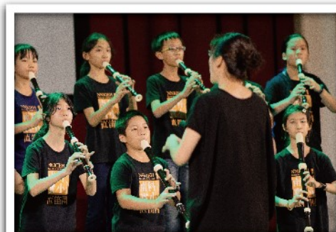
國小直笛團的演出