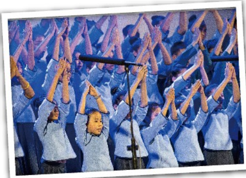
活潑可愛的國小合唱團