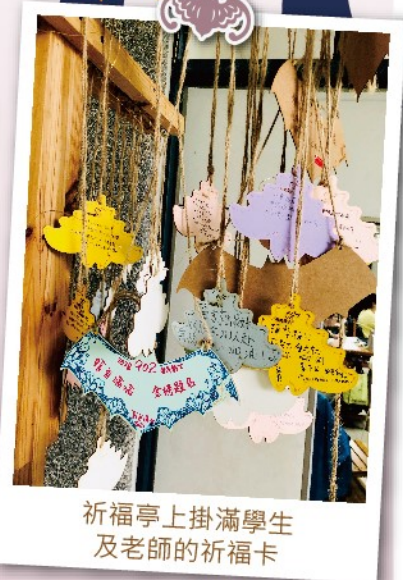
祈福亭上掛滿學生及老師的祈福卡