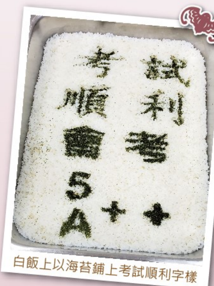
白飯上以海苔鋪上考試順利字樣