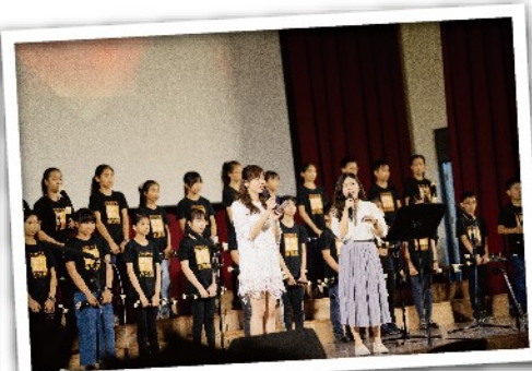
兩位美麗的主持人