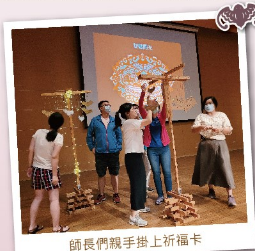
師長們親手掛上祈福卡