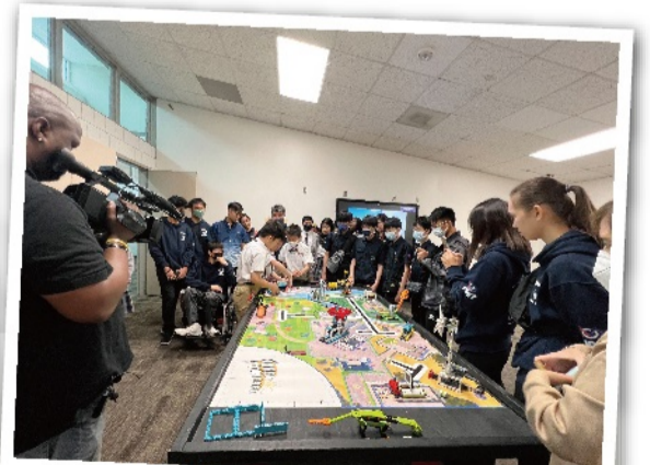
SSMA 是一所強調數理、PBL及環境永續教育的同質學校