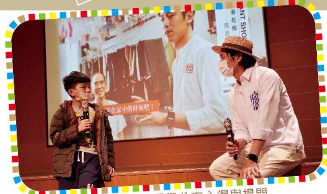
同學分享心得與提問