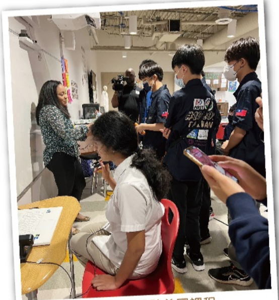
學生實際體驗美國課程