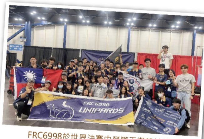
FRC6998於世界決賽中榮獲工業設計獎