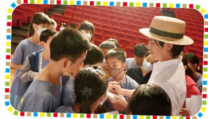
同學們請老師簽名與留下鼓勵的字句