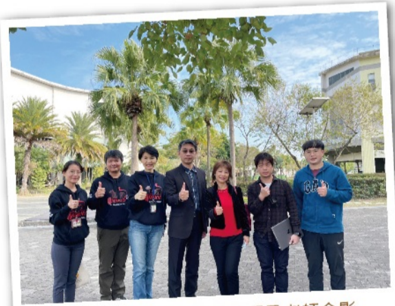
SSMA梁校長與本校蔡校長及老師合影

支參賽隊伍，分布於8個分區，「工業設計獎」各頒給一團隊。南科實中隊能在78支勁旅中脫穎而出，顯示學生在機器人程式結構、外觀功能、工程筆記具完整決策與精密製造的優異表現，獲世界級競賽的認證，也再一次成功讓世界更看見臺灣的軟實力。