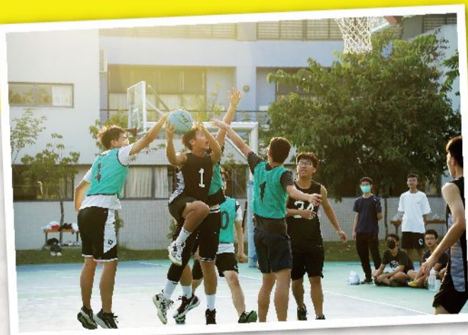
籃球在人群中飛揚，可惜這次的主角不是籃球，而是我們

匆匆走過南科三年，熟悉的樹影在窗戶外搖曳，歡呼過的舞台和丟過球的走廊卻已不再充斥著我們的歡笑，回頭再望眼校園的風光，暖陽依舊灑在生態池上，畢業前的最後一聲下課鐘已響起，讓我們一起對精彩的高中生涯喊聲：「夏刻謝謝！」