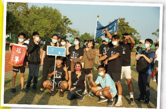
一班一家親。雖然人數較少，但也默默建立了如家人般的感情

和煦的夕陽映在生態池水面，波光粼粼之上漂浮著承載未來的荷葉，左右搖擺的校鴨仍在校園裡嬉戲，活力充沛的松鼠們仍在樹梢間玩耍，而我們卻匆匆在南科走過一遭，耳邊依稀響起了最後一聲下課鐘。