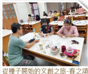
從種子開始的文創之旅-春之頌