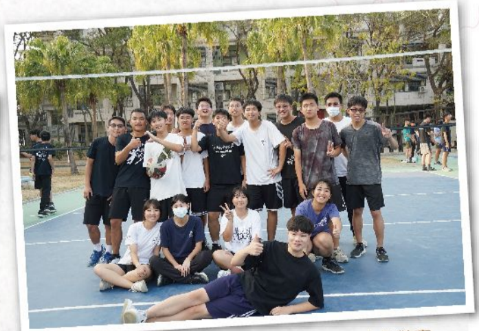
排球賽後的疲態，掩不住我們彼此心中的歡喜