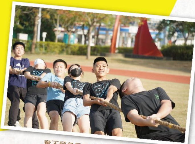
奮不顧身是我們最佳的代名詞