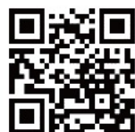
聯合國永續圖書俱樂部 SDGs Book Club