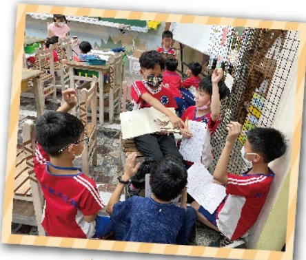
事前準備-說給小組聽