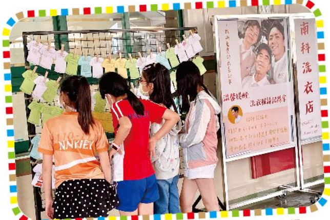
相約到南科洗衣店欣賞講座心得