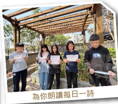
為你朗讀每日一詩