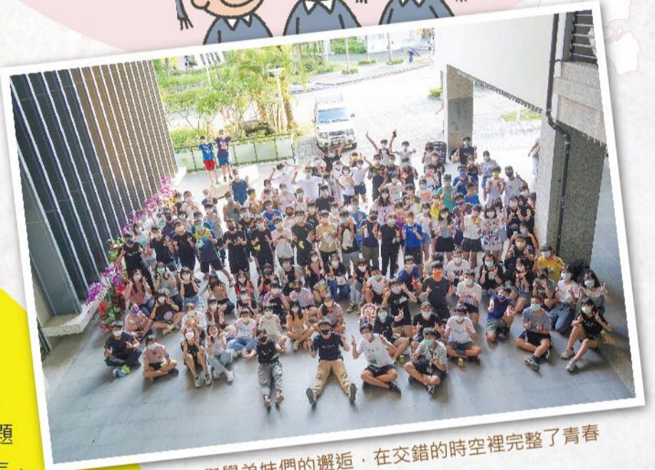
那天下午與學弟妹們的邂逅，在交錯的時空裡完整了青春