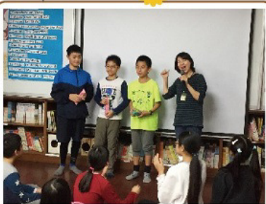
六年級 Singing English Songs 主題活動