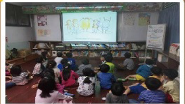
二年級 Five Little Monkey 主題活動

搭配不同讀劇活動，閱讀老師也設計了學習單，讓小朋友的學習得以延伸，創意得以發揮。圖書館同時於活動期間搭配書展，配合讀劇內容，將主題書展帶入活動中。希望透過活潑又多元的媒介，讓小朋友對語言學習多一份興趣。