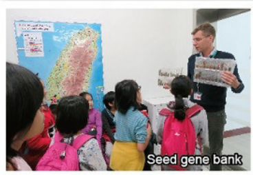
Seed gene bank

Most of us expected a field of grass and occasional sprouts of other types of flora that interrupted the peaceful, yet uneventful, terrain. It was to our genuine surprise, however, to behold a technologically-advanced laboratory at the World Vegetable Center on January 23, 2018. The laboratories and buildings seemed to blend harmoniously into the surrounding farms and greenhouses, giving off an aura of industrialism and beauty. Near the gates, international flags soared to the sky, while a circular field of flowered bushes adorned the middle of the complex. Ironically, there was a volleyball court to the left as well. It was then, after the group picture, that we