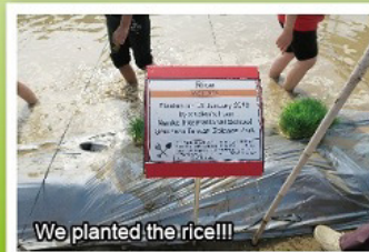
We planted the rice!!!