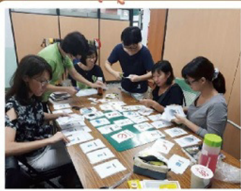
故事媽媽共備製做道具

國小部故事媽媽團自去年成立以來已經邁入第二個年頭。去年「小王子」的讀劇活動備受好評，今年夾帶著無比的新鮮感與挑戰性，故事媽媽們再度挑戰難度更高的英語讀劇。在國小部閱讀老師的帶領下，故事媽媽們每週四定期聚會共同備課，完成選書、寫劇本、討論課程、主軸安排等活動，目的就是為學生呈現多元的閱讀經驗。