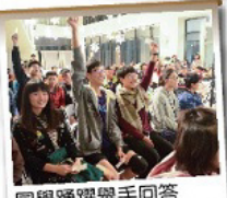
同學踴躍舉手回答