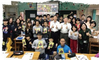
廣達遊於藝活動合影

期勉南科的教職同仁：勿負本校優秀的學生素質，並善用家長雄厚後援及社區豐富資源，將「全球視野」融入課程教學，激勵學生用行動解決世界問題的企圖心，帶領孩子從台灣出發連結世界，一同為塑造21世紀新國際人才而努力。