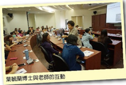
葉毓蘭博士與老師的互動