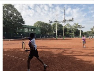
107台南市中運，本校網球隊勇奪佳績