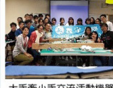
大手牽小手交流活動機器人研究方法同學與義守大學外籍學生合影