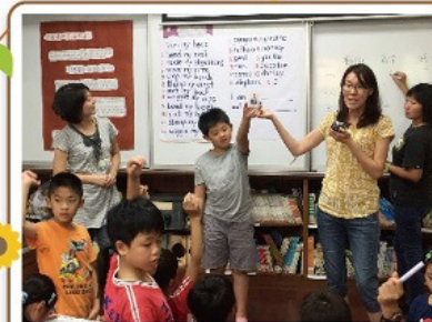
四年級 From Head to Toe 主題活動