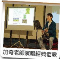
加奇老師演唱經典老歌