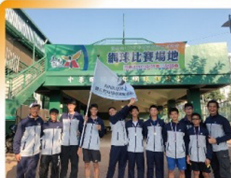
107台南市中運，本校網球隊勇奪佳績