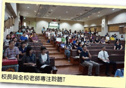
校長與全校老師專注聆聽