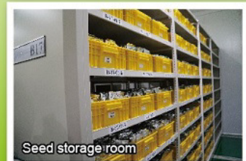
Seed storage room