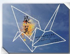
◀靜態展的宣傳海報《築翼》