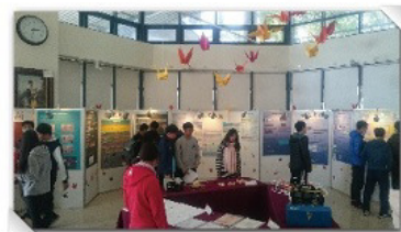
◀展覽會場交流學習