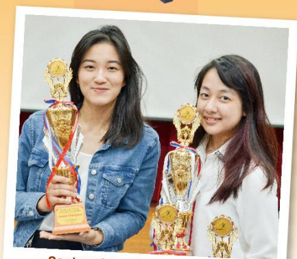
Senior girls take home the win in the Debate competitions