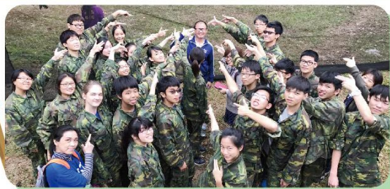
南科實中高一公訓

看著學生們從各說各話到聽別人說話，從旁觀理性的觀察到主動熱情的參與。挑戰造就了領袖、懼怕造就了安慰者；因著團隊榮譽，願意放下自己、成為他人支柱，不僅對自己負責更是對他人盡責。好一幅課堂外的美麗風景，這是實中的熱血青春，帶不走的美好回憶。