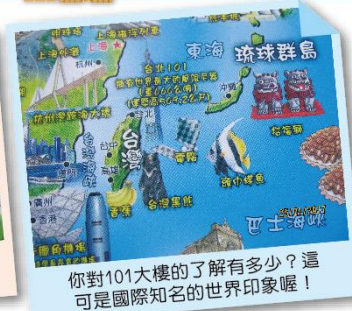
你對101大樓的了解有多少？這可是國際知名的世界印象喔！