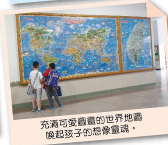
充滿可愛圖畫的世界地圖喚起孩子的想像靈魂。