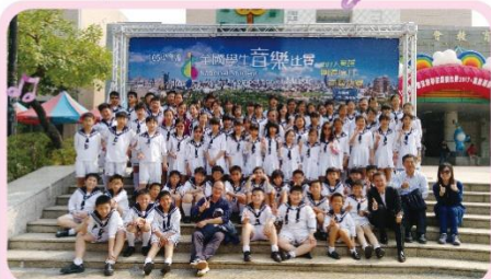
小學的孩子們開心的與師長們合照