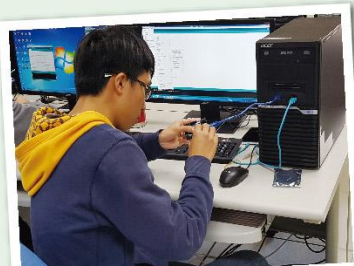
結合Arduino進行程式設計