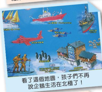
看了這個地圖，孩子們不再說企鵝生活在北極了！