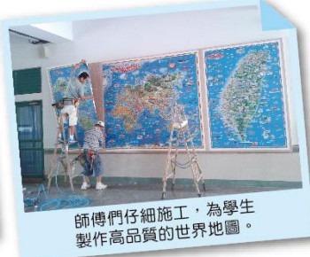
師傅們仔細施工，為學生製作高品質的世界地圖。