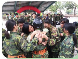
不怕，安全了，我們都在