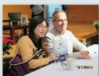
費屈曼先生與粉絲合影

講座結束後，舉辦簽書會，許多參加講座的人開心帶來費屈曼先生的著作請他簽名，他耐心的一一為粉絲簽名並他們合照。在輕鬆愉快的心情下，圓滿的結束這場難得的國際性講座。