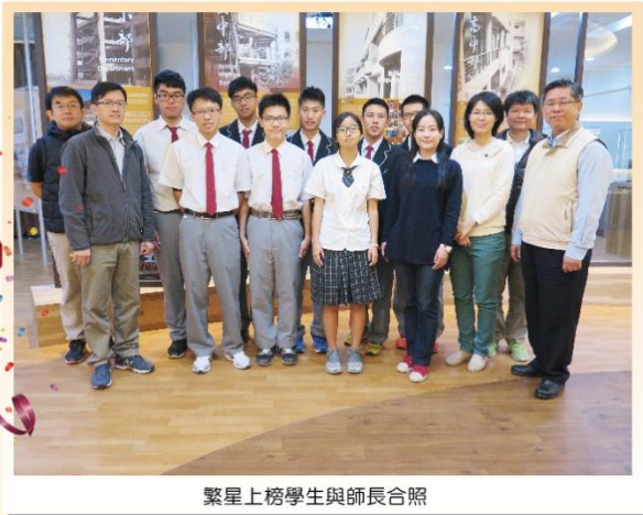
繁星上榜學生與師長合照