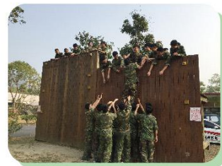
高牆凝聚大伙的心