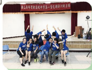
雙語部也樂在其中