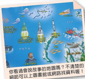
你看過會說故事的地圖嗎？不清楚的細節可以上圖書館或網路找資料喔！

然而，走向世界之前，我們也期許學生們對臺灣能有更多的認識與了解，從最親愛的土地出發，才能在世界找到一個安身立命的位置。因此，在世界地圖的旁邊設立了「台灣印象地圖」。低年級的孩子最喜歡和爸爸媽媽在這個地圖上開心的尋找著旅遊去過的地方，順便看看地圖裡還有哪些有趣、特別的景色，增長知識也啟動下一次出遊的能量。找個時間來看看這裡的地圖，你會發現國家不再只是一個冰冷的名字，這裡有每個國家的特殊印象，等待你去發掘、探索。如果你對地圖中的動物、歷史故事非常有興趣，也可以上圖書館或網路找資料，未來，你也可以試著畫一張你所認識的世界印象地圖喔！