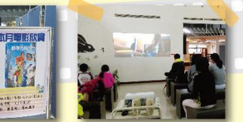
實中電影院，首映即受到好評