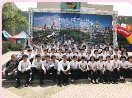
氣質非凡、成熟穩重的高中國