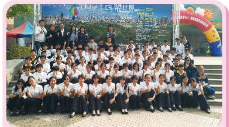
喜樂滿載的國中國