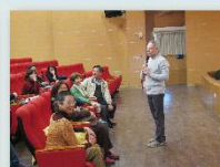
大師言詞幽默讓大家心情好輕鬆