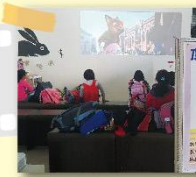
國小部的學生也來觀賞