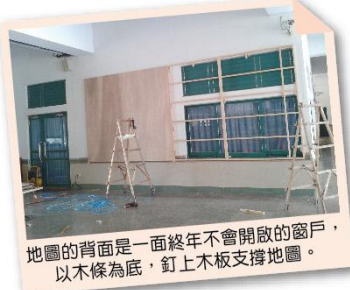
地圖的背面是一面終年不會開啟的窗戶，以木條為底，釘上木板支撐地圖。