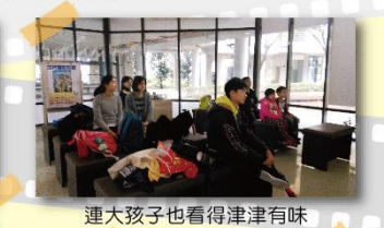
連大孩子也看得津津有味