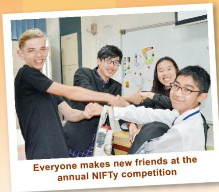
Everyone makes new friends at the annual NIFTy competition

Every year the event improves and the students'skills grow. Most of the teachers and students from grades 4-12 volunteer many hours to help make this annual event a great success for the competitors. NIFTy is one of the highlights of the school year for IBST!