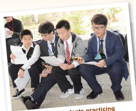
8th grade students practicing at the last minute