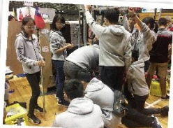
6998機器人下場後團員立即進行機器人檢修