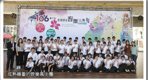
成熟穩重的管樂高中團