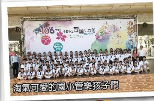
淘氣可愛的國小管樂孩子們