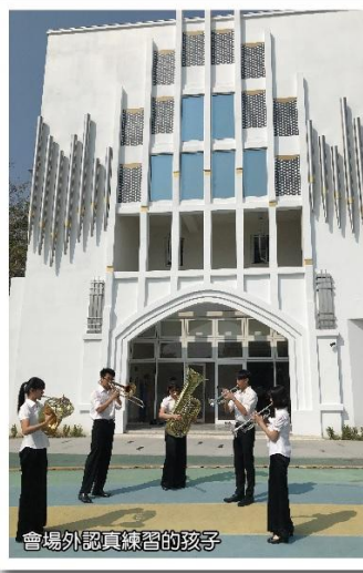
會場外認真練習的孩子

南科管樂十年有成，邀您於6月和我們一起在台南市文化中心演藝廳，分享樂團10週年的喜悅