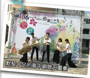
默契十足的高中銅管五重奏