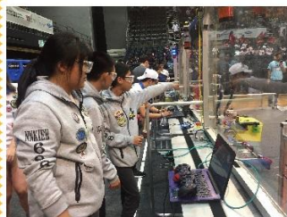
團隊齊心齊力、聚精會神，爭取獲勝機會