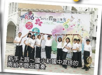
新手上路~國小和國中混搭的兩組木管五重奏