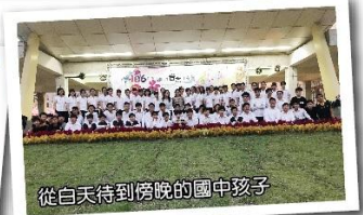
從白天待到傍晚的國中孩子