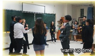
warm up time