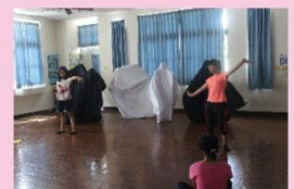
成果展 - 戲劇表演