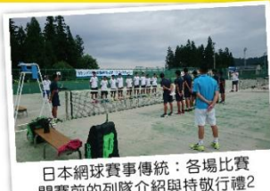
日本網球賽事傳統：各場比賽開賽前的列隊介紹與持敬行禮2