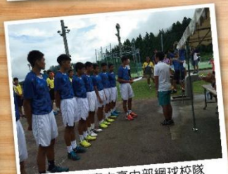
國立南科實中高中部網球校隊力抗日本各隊好手，榮獲亞軍