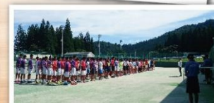
日本高校網球對抗賽之開幕式，高達四十二所日本高校網球校隊，參與盛事