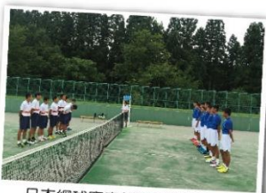
日本網球賽事傳統：各場比賽開賽前的列隊介紹與持敬行禮1