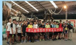
八年級學員參訪後壁日光石頭博物館，與巨型化石合照