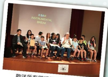
歡送所有即將離開我們校園的老師與學生