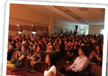
雙語部家長、師生共同欣賞表演

“Into the Wild” into their end of the year film. Along with the help of the school's tech crew, they filmed a short and successful film with limited resources inside the school. IBST is a small melting pot consisting of ethnicity from different places around the globe. This adds on to how special this small community is, and with cooperation and commitment from people belonging to different backgrounds the end of year performance is no easy project.