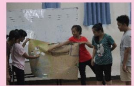
上台發表在認識校園中尋獲的寶物

對於即將面對嶄新國中生涯和環境的新生來說，參加表演藝術營不僅能讓新生熟悉校園和認識新朋友，更重要的是發展無限的表演創意。這次我們邀請到知名舞團的舞蹈老師，帶領學生把肢體的延展和創意發揮的淋漓盡致，以及由優秀的表演藝術老師指導學生呈現精彩的戲劇表演，學生除了學習表演能力，也能了解到如何經營團體精神，並且訓練上台時的台風和自信。