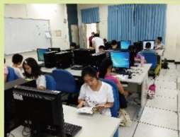
同學們認真學習設計遊戲