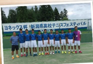
參加「平成29年度第18回YONEX盃新潟縣高等學校テニスフェスティバル」之盛事