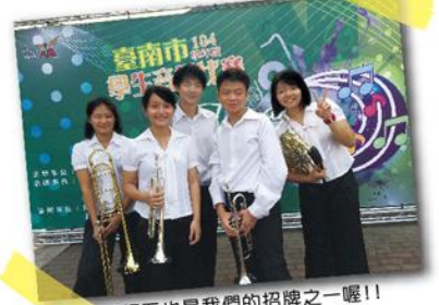
銅五也是我們的招牌之一囉!!