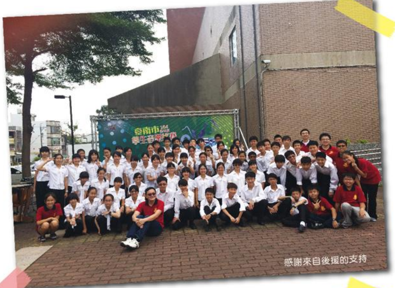
感謝來自後援的支持

在國際化與創意並重的南科園區裡，一個樂團的成就來自於很多後援的支持，讓我們能在龐大的組織分工下與各項資源的統合中，給予樂團資源與機會用熱情來為音樂文化注入一份希望與活力。由衷感謝陪伴我們努力過的家長、夥伴們，相信未來會有更多的目標等著我們去完成，帶領著孩子們一起成長，種種歷練，堅持的本色唯真誠、用心，用真誠與夥伴們一同前進，以用心面對樂團所有任務。