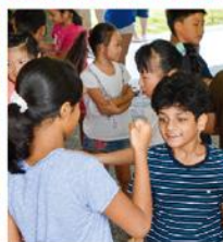
A grade 3 student and a Grade 6 students face off in the competition.