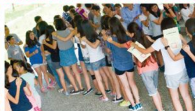
When students were eliminated, they walked to the back of the "conga line". This photo shows the final meeting of the last two winning students.