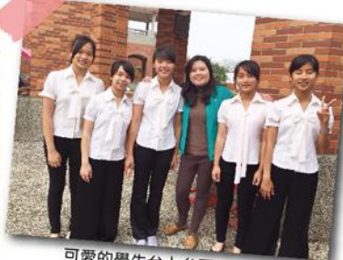
可愛的學生上台台下兩樣情