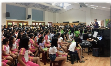
和其他學校一同練唱