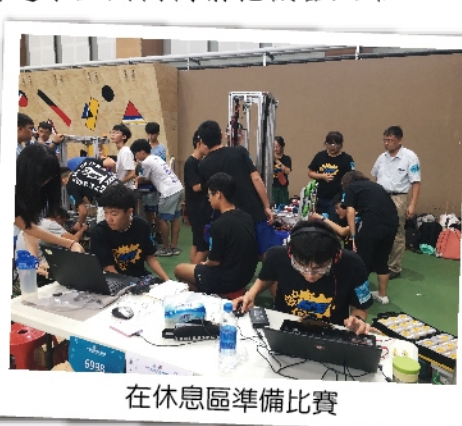
在休息區準備比賽