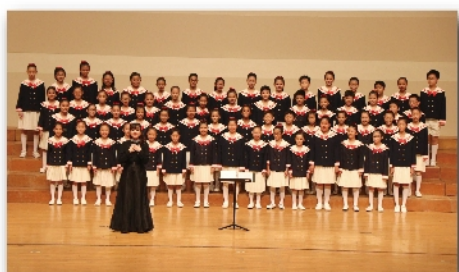
南科實中國小部合唱團演出