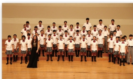
南科實中合唱團演出