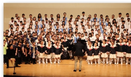
中學小學450人大合唱