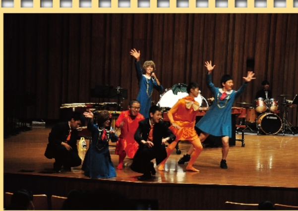
關西高校精彩演出