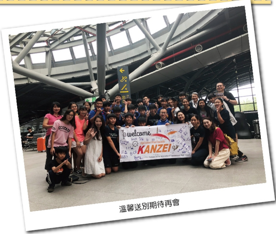
溫馨送別期待再會

充實的暑期活動為合唱團員們帶來新能量，團員們為音樂而歡唱、為友誼而雀躍、增進見識同時也學習成長，旋律串起我們的友誼，透過音符，我們熱愛音樂的心，沒有距離。