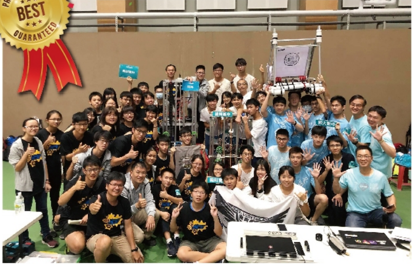
冠軍聯盟(協同中學、南科實中、師大附中)合照

南科實中#6998團隊於8月底參加全國FRC季後賽，並在排名賽中於14隊隊伍中獲得第5名，並在第二階段Alliances(自選聯盟)以第一順位之姿被協同中學選中，之後與協同中學、師大附中組成聯盟，並在決賽中獲得冠軍。