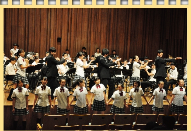
樹谷三團聯演盛況

南科實中國中部合唱團今年暑假活動盛事連連，首先七月赴日本高松參與文化音樂祭活動，在八月又迎來關西高等學校師生來校參訪交流。此次關西來台參訪交流活動約五天，除了策劃兩場風格迥然不同的音樂會，也讓日方學生寄宿於樂團學生家以期增進國際文化體驗。