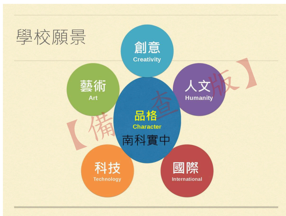
南科實中學校願景圖