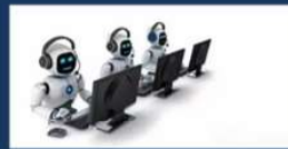
OPENVOICE 僅需10秒樣本即可語音複製