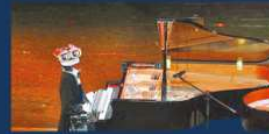
MUSICGEN 透過文字提示生成音樂