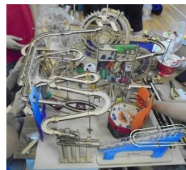
圖 1：多結構滾珠機器(範本)