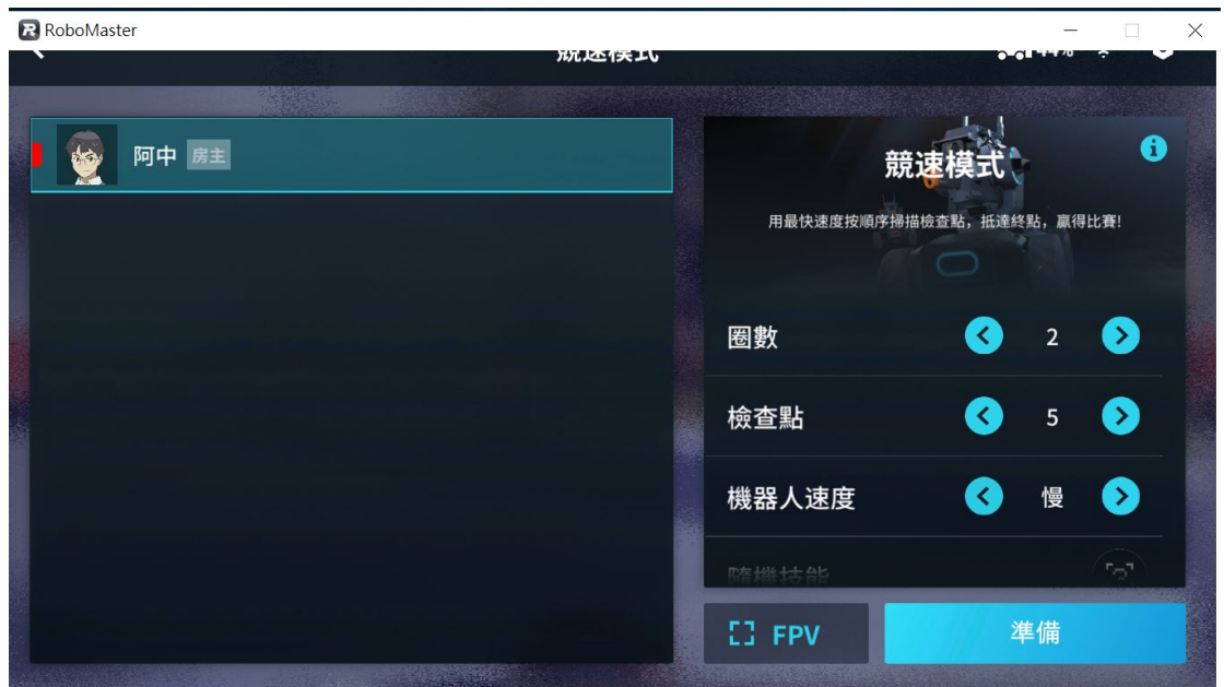
[圖四] RoboMaster程式；競速模式示意圖