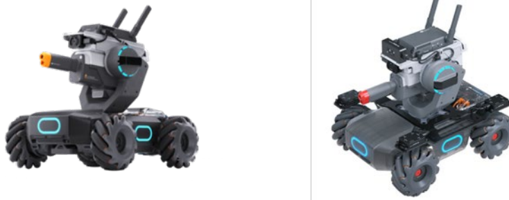
[圖一] 參賽機器人示意圖