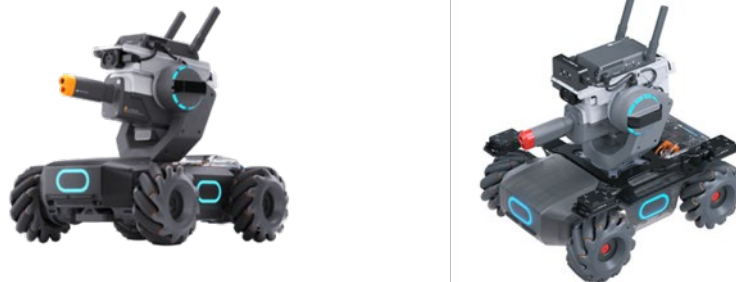
[圖一] 參賽機器人示意圖