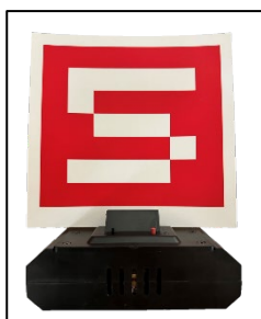
[圖三] 固定標靶示意圖

比賽場地共設置 5 組固定標靶，靶面為長 17cm x 寬 17cm 的原廠紙卡 (如圖三)。紙卡上為數字 1~5 號進行隨機擺放位置。瞄準紙卡靶心，以彈道燈光束射擊，完成擊倒後即可得分。