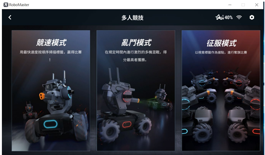
[圖三] RoboMaster程式；競速模式示意圖

(一) 啟動 RoboMaster 程式，進入多人競賽、競速模式。(如圖三、圖四)