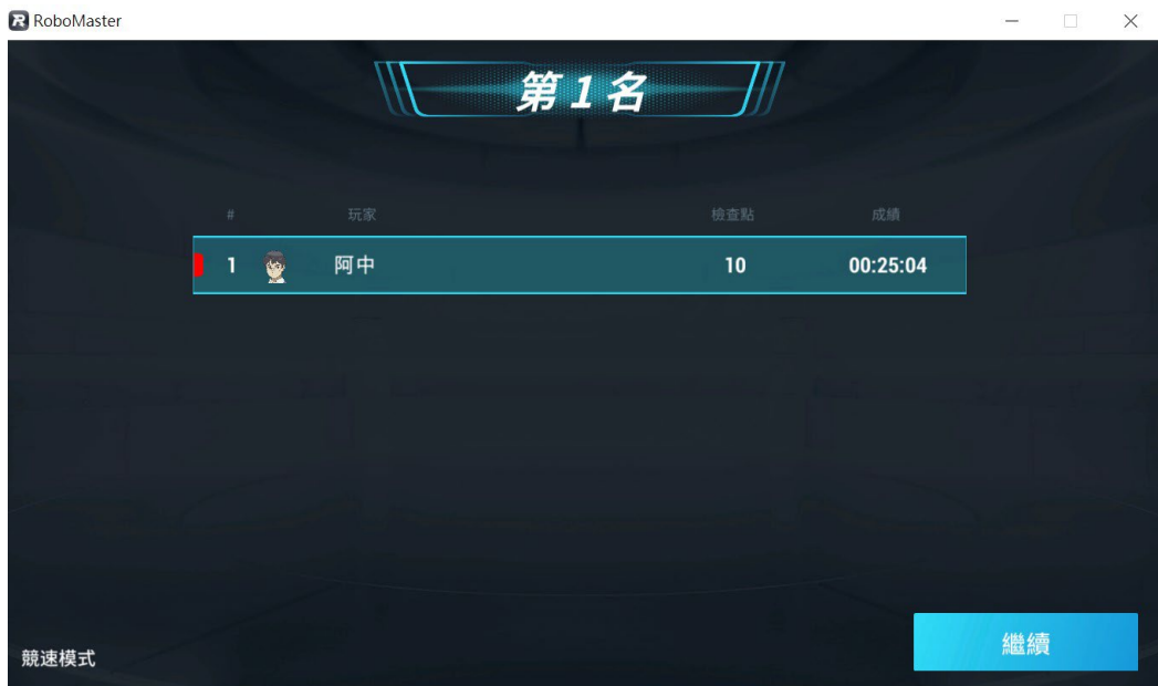
[圖六] 競速模式分數顯示示意圖