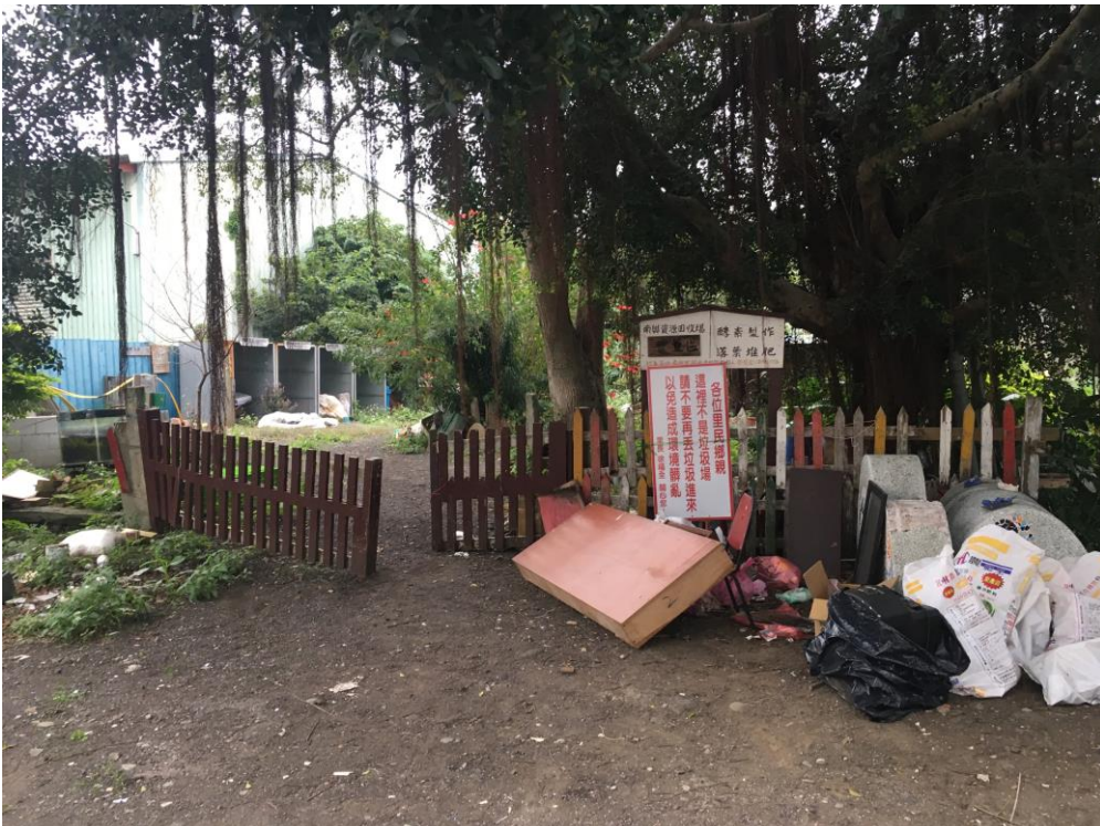
圖 現況照片，左為樟樹右為榕樹，內有堆肥區與資源回收區