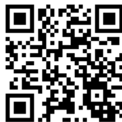
國立空中大學推廣教育中心 臉書粉絲專頁 QR Code