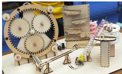
圖 1：多結構滾珠機器(範本)