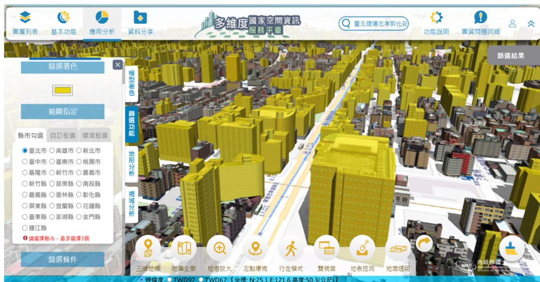
圖 3 平臺操作畫面-篩選並以黃色標示臺捷運忠孝復興站周邊 10 樓以上建物

全國最新版三維建物模型成果自即日起對外供應，可於「多維度國家空間資訊服務平臺」（網址： https://3dmaps.nlsc.gov.tw ）瀏覽查詢，並開放公文離線申請大範圍或線上點選申請小範圍實體圖資，以及提供免申請介接國際標準 OGC I3S 及 3D Tiles 網路服務。三維建物模型產製詳細說明及實體資料供應，請至前開平臺-「圖資說明-三維建物產製及更新」及「服務內容及成果供應-實體資料供應」查詢。